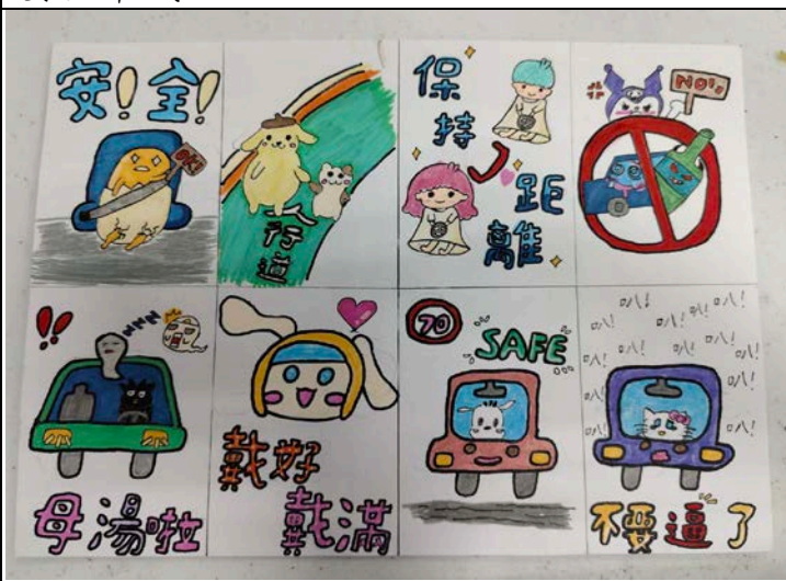
照片說明：交通安全創意貼圖優秀作品展示。