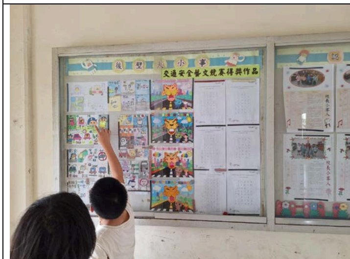
照片說明：利用學校公佈欄張貼交通安全藝文競賽優秀作品，讓全校師生、社區民眾觀賞，進而達到宣導效果。