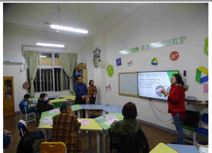
照片說明：親職教育講座宣導交通安全—內輪差、新聞時事。