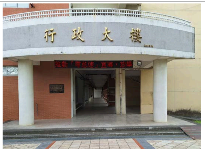
照片說明：利用跑馬燈向家長及社區民眾宣導交通安全政策及宣導標語。