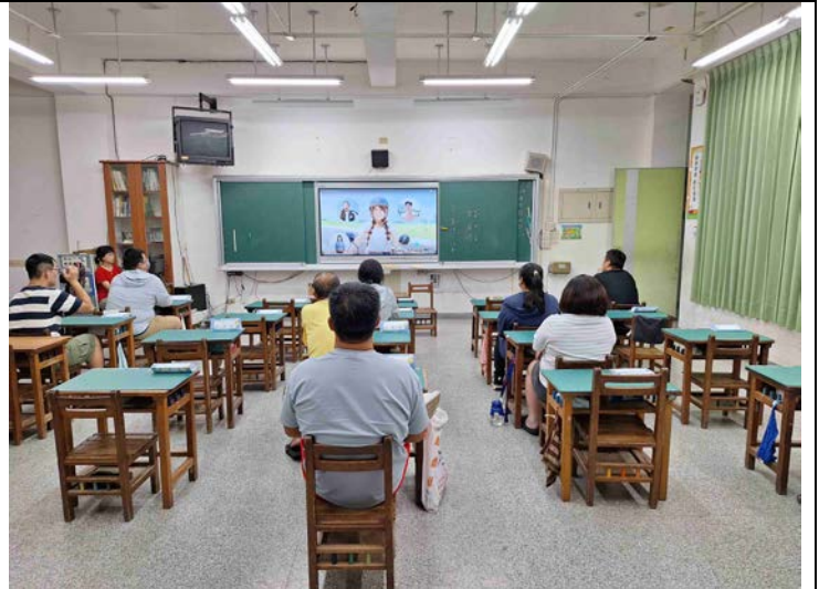
照片說明：利用班親會由各班老師進行交通安全宣導(騎乘機車要戴安全帽、九月交通安全月宣導主題)。