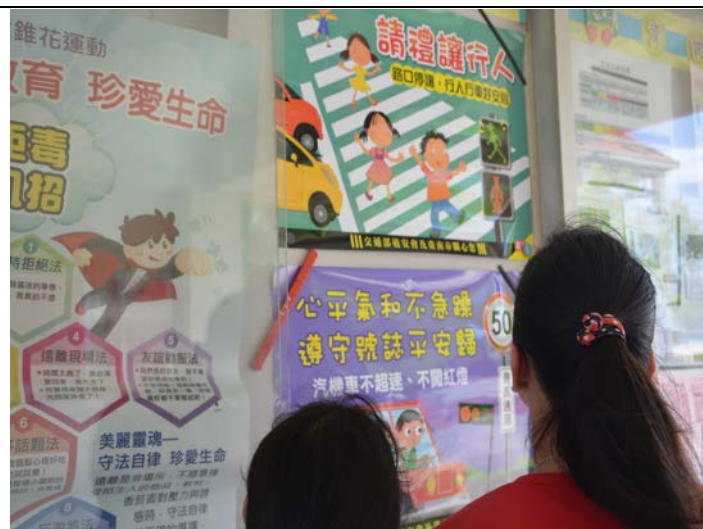
照片說明：利用學校公佈欄向師生宣導交通安全常識。