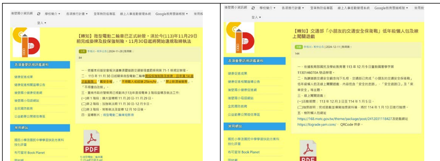
照片說明：利用學校網頁向師生及民眾進行交通安全宣導、及補充相關教材。