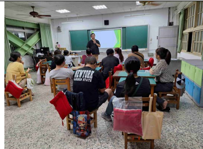
照片說明：利用班親會由各班老師進行交通安全宣導。