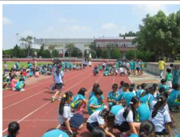
照片說明：開學日第二節下課全校路隊編排