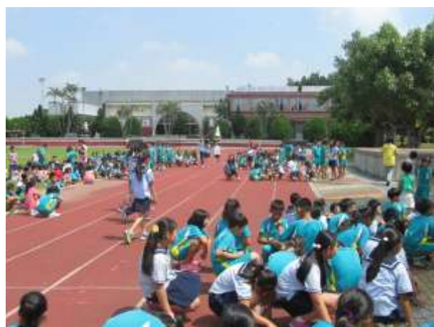
照片說明：路隊長領取登記表記錄違規名單。