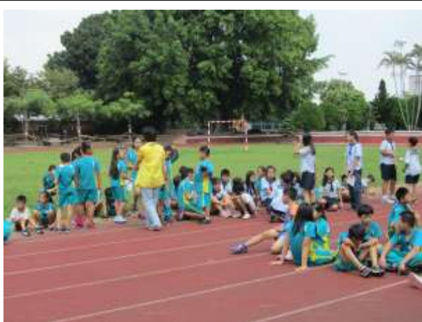
照片說明：各路隊編排。