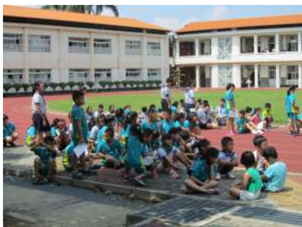
照片說明：各路隊選出一路隊長