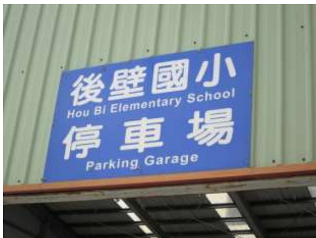
照片說明：後壁國小停車場標誌。