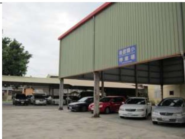
照片說明：教職員工專用停車場位於校外。