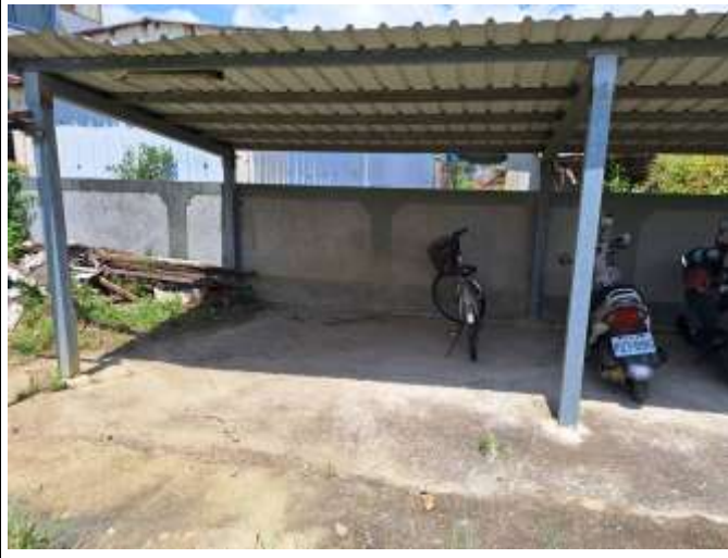
照片說明：學校教職員工機車及學生腳踏車停放於專屬停車棚