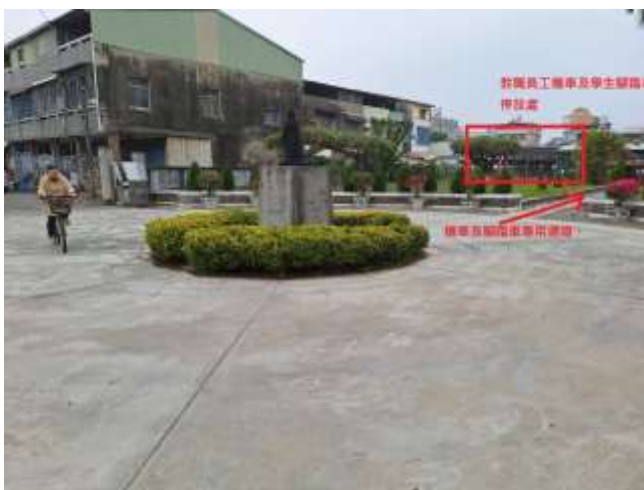
照片說明：南校門機車有專用道，與學生進入教室動線分流。