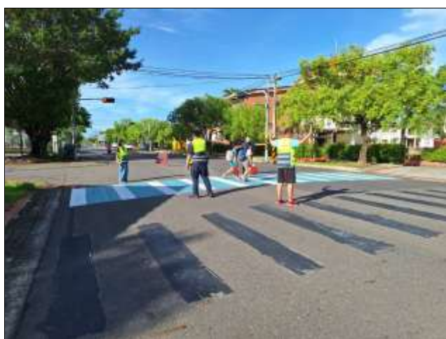
照片說明：東校門導護及志工共同指揮學生安全過馬路