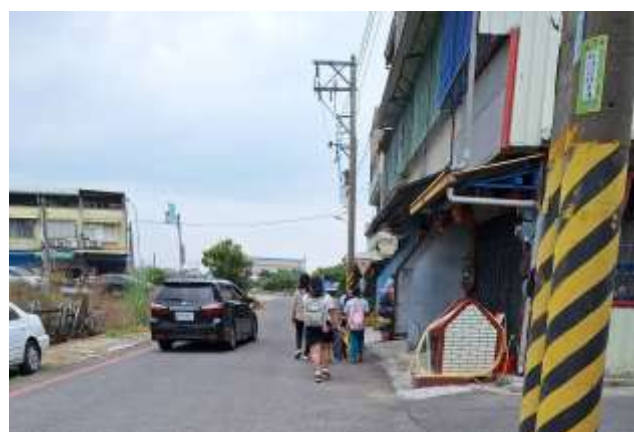
照片說明：總導護老師帶從南校門回家的學生安全過馬路。