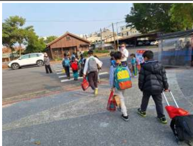
照片說明：東校門導護指揮學生放學安全過馬路