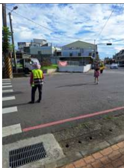
照片說明：侯伯橋導護工作執行情況