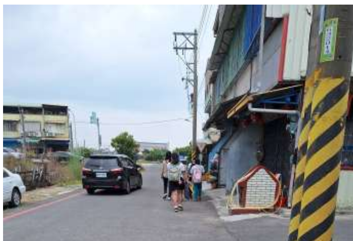
照片說明：放學時間由總導護老師戴自行走路回家的學生安全過馬路。