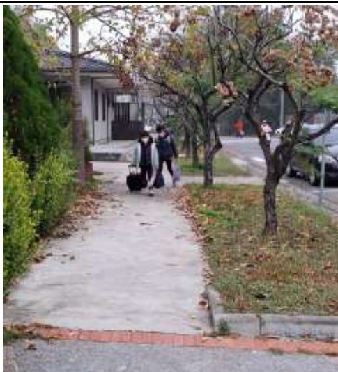
照片說明：家長接送的學生於學校外圍人行道自行步行入校。