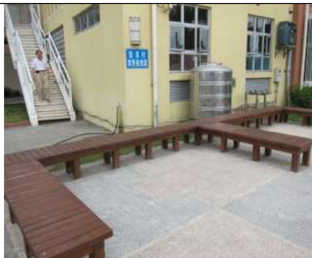
照片說明：於家長接送區設置座椅供來接送學生的家長能暫時休憩。