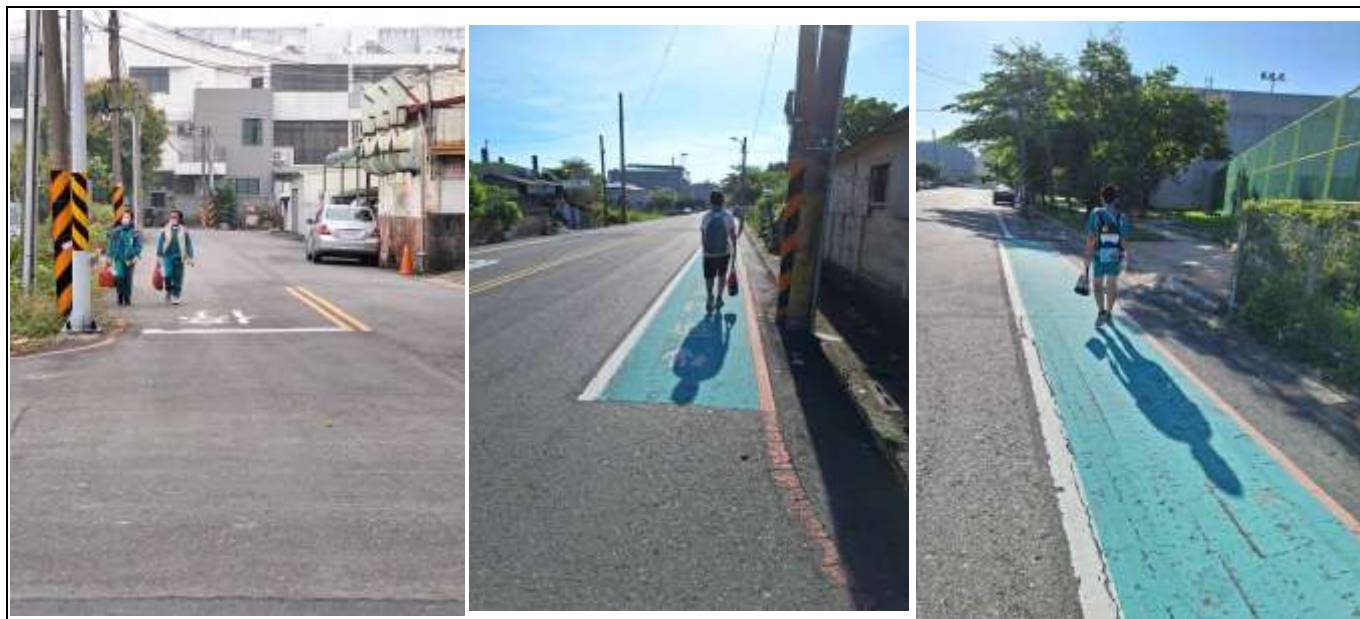
照片說明：居住在學校周圍學生步行上學，並能善用通學步道。