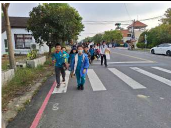
照片說明：安親班放學以步行走回目的地。