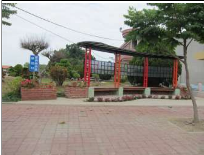
照片說明：侯伯里家長接送區。一旁設置座椅供家長於等待時能坐下休憩。