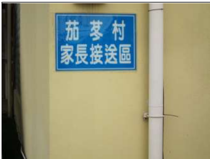
照片說明：下茄苳里家長接送區標誌。