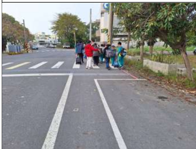
照片說明：安親班放學以步行走回目的地。