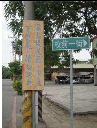
照片說明：上學時間，請在此下車，勿迴車。