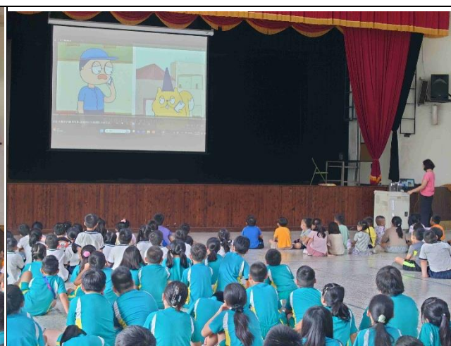
照片說明：學生週會時間進行交通安全宣導—交通安全五守則說明。