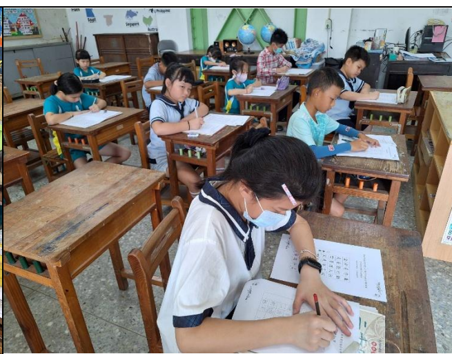
照片說明：辦理交通安全藝文競賽(藝術創作及硬筆字比賽)