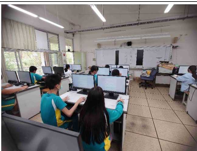
照片說明：辦理交通安全常識測驗。(左圖為低年級，右圖為中高年級)