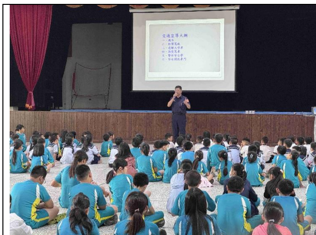
照片說明：白河分局警員到校進行交通安全宣導