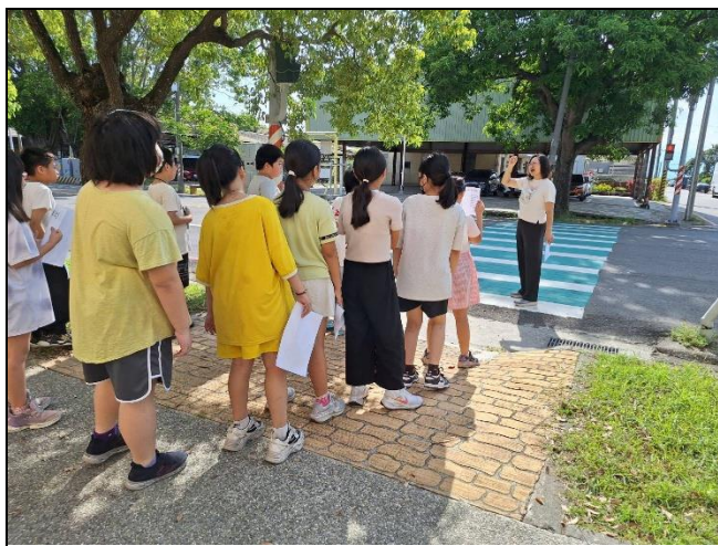
照片說明：社區踏查暨交通安全情境宣導