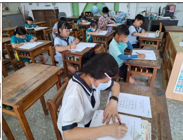
照片說明：舉辦硬筆字比賽，各班選手到指定地點參賽。