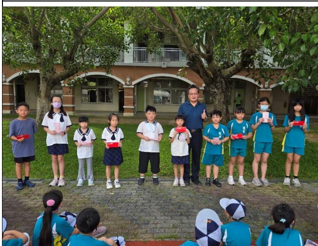
照片說明：各年級硬筆字比賽得獎學生由校長頒獎。