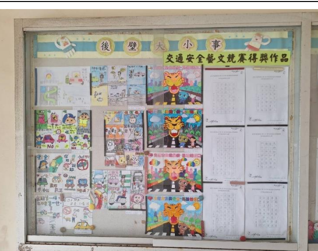
照片說明：硬筆字比賽得獎作品張貼在穿堂供全校師生觀摩欣賞。