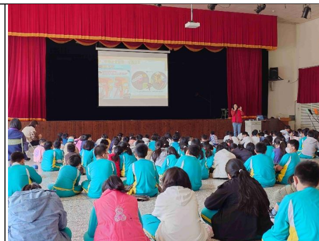
照片說明：學生週會時間進行交通安全宣導—騎乘自行車安全、遠離大型車內輪差。