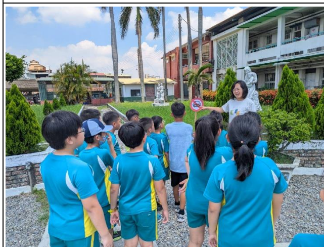
照片說明：學校地形地物之交通標誌教學