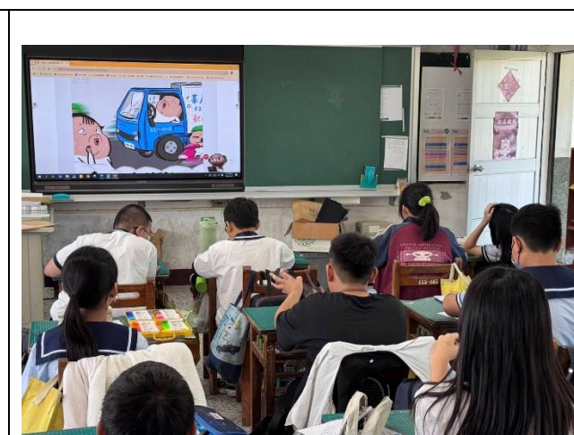
照片說明：交通安全週各班進行交通安全宣導。