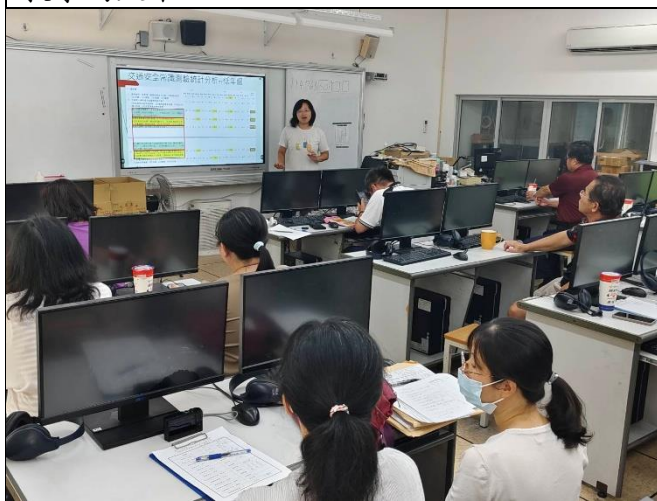
照片說明：利用週三教師研習進行學生交通安全常識測驗統計分析，提供各位老師施行交通安全教育教學策略及主題的調整參考。