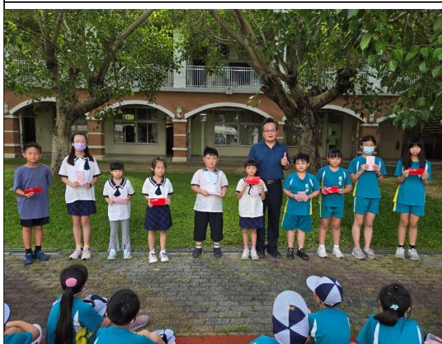
照片說明：各年級硬筆字比賽得獎學生由校長頒獎。