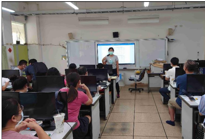
照片說明：利用教師晨會討論自行車路考成效