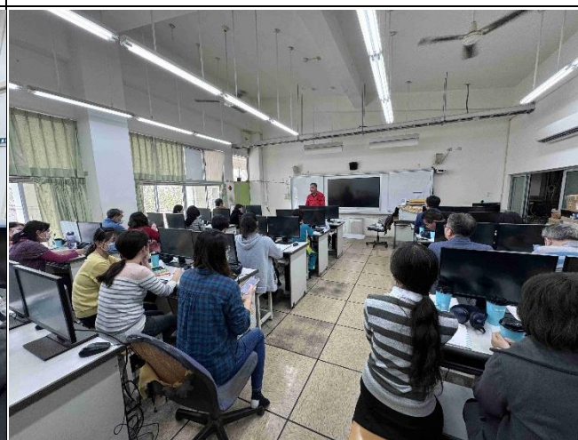
照片說明：利用校務會議討論交通安全情境教學的效果