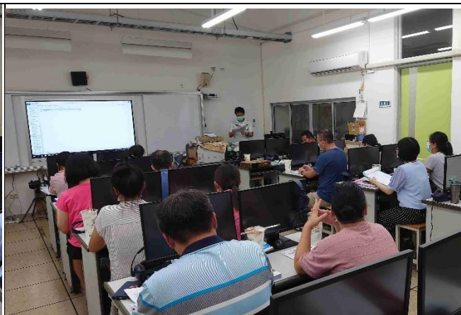
照片說明：利用教師晨會討論自行車路考成效