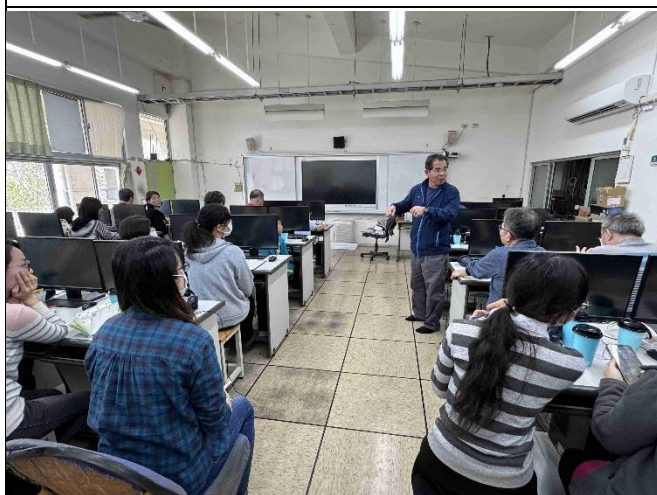
照片說明：利用校務會議討論交通安全情境教學的效果