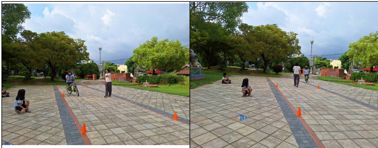
照片說明：辦理自行車考照一路考。(安全帽檢查、平衡度及騎乘技術檢測)