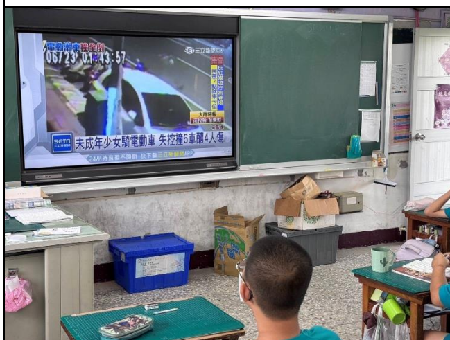
照片說明：配合交通安全月，班級進行交通安全宣導。