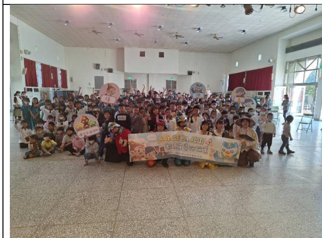
照片說明：114 年「府城有禮人本交通新文化」系列宣導活動。