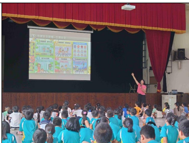
照片說明：學生週會進行交通安全宣導。