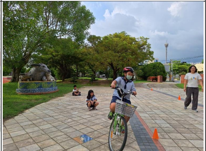
照片說明：自行車路考-s 形測驗