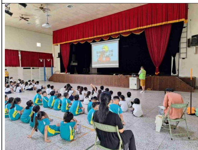
照片說明：邀請創世基金會到校進行騎車安全宣導。