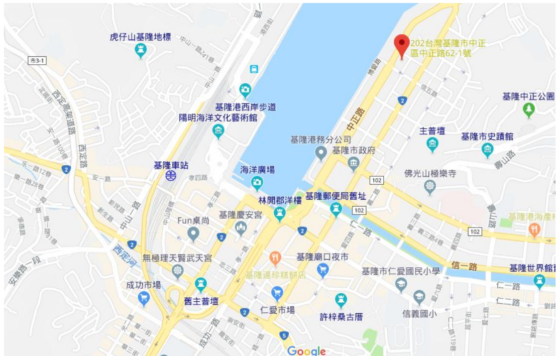
長榮桂冠酒店19樓咖啡區南區

https://www.evergreen-hotels.com/branch2/directions/?lang=zh-TW&d1b_Sn=4