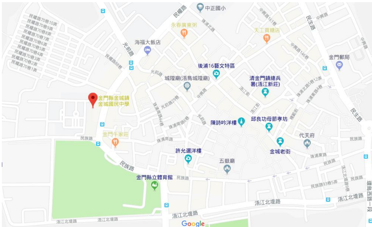
金門縣立金城國民中學 圖書館四樓