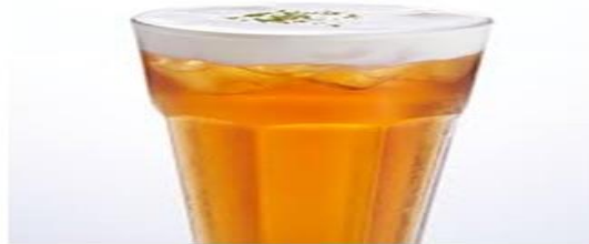
冰紅茶 杯器皿 可林杯/吧叉匙/沖茶器/雪平鍋/量酒器/搖酒器/沖壺 材料 6 公克紅茶茶葉 30ml 果糖