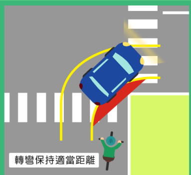
轉彎保持適當距離