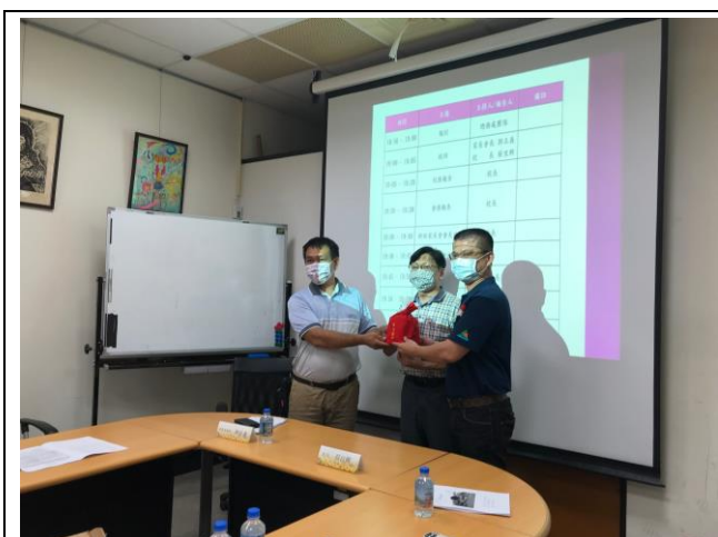
說明：新舊任會長交接儀式

經年累月以來，公部門對學校經費的補助向來非常有限，但孩子的學習卻不容等待。為了孩子的精進成長、為了教學品質的提升，校長、家長會長與本校教職員工懇請您共同來支持學校，歡迎您加入家長會，共同來為海佃國中盡一份心力。若您因事業繁忙，無暇參與，我們亦歡迎您以愛心捐款方式來支持校務運作。