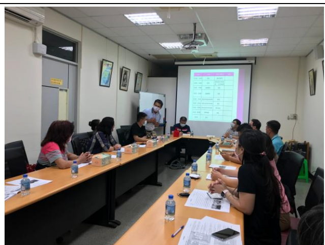
說明：家長會代表大會