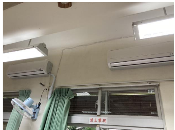
說明：冷氣裝設電力改善工程