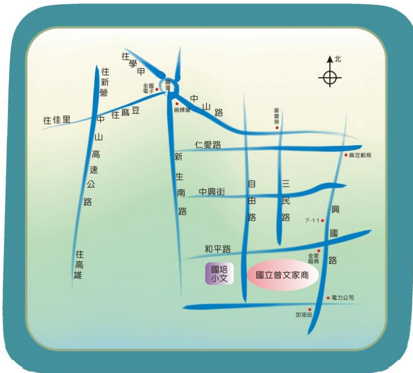
附圖一 承辦學校國立曾文家商位置圖