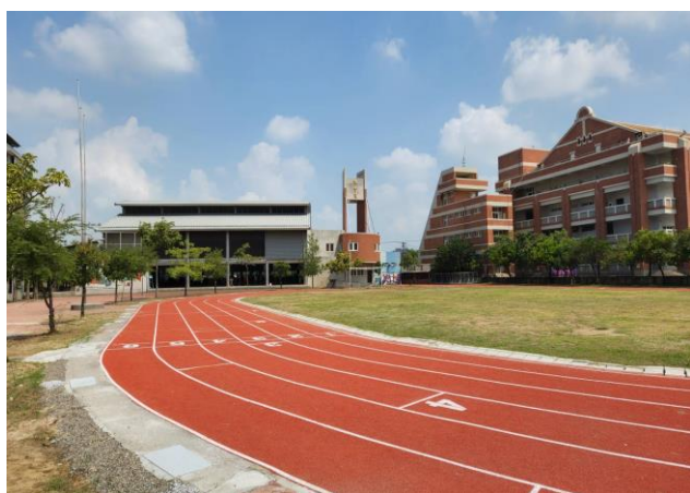
操場 PU 跑道重建

近年來學校努力爭取經費，相繼完成「校舍地磚改善工程」、「監視器系統改善工程」與「圖書室空間改善工程」等重要建設，提供全校師生安全舒適的活動空間。並配合市政府政策進行「新設幼兒園空間改善工程」，提供全新教學環境及完善教學設備，課程多元活潑，以滿足幼兒多樣性的學習需求。另外為滿足學生多元學習需求新設童軍野炊區、射箭場、教室冷氣裝設、操場 PU 跑道，其中光電停車場、籃球場已於 112 年 5 月底完工啟用，目前本校預定與進行的工程有郡安路、富東路通學步道改建、第一、三期男生廁所改建、善群樓、敏學樓及敬業樓地盤灌漿及建築物扶正、安富街校門口銘牌工程等，施工期間學生與家長請留意工地安全，完工後能提供全體師生更優質的學習環境與教育空間。