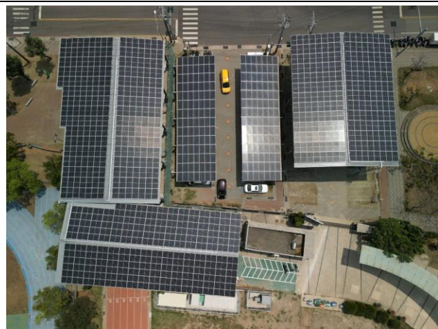
光電籃球場與停車場