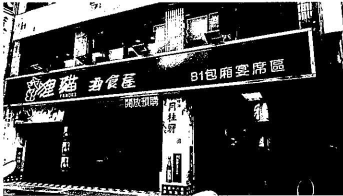
所在大樓一樓外觀

因停車位較少且拖吊開單頻繁，建議採用大眾運輸工具前往：可搭乘捷運板南線，由 忠孝新生站 2 號出口 ，徒步前往約 2 分鐘；中和新蘆線則建議由 忠孝新生站 5 號出口 ，徒步前往約 2 分鐘。