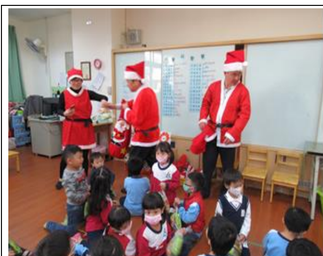
說明：家長會與志工團參與本校耶誕節發送糖果活動

學校校務推動順遂與否，健全的家長會具有舉足輕重的關鍵影響力。感謝家長會捐助經費補助學生參加各項比賽(例如：射箭、空手道、音樂、舞蹈、小小解說員、國語文與英語文競賽)的交通費與餐費，本校同學在各項比賽均榮獲佳績，同時提供獎勵金予獲獎師生，讓得獎者獲得最佳的實質鼓勵。家長會所有成員誠摯邀請有意願之家長加入本校家長會運作，與學校攜手合作，一起共創優質教育。