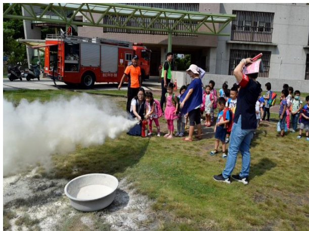
迷你消防員-滅火器體驗