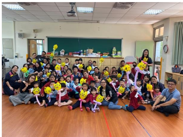
氣球造型體驗-圓滿大合照