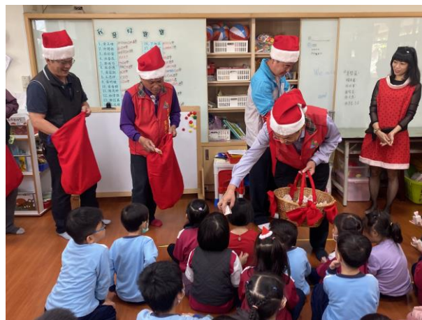
聖誕老人來發禮物囉！