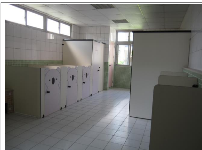
說明：佃中附設幼兒園一廁所