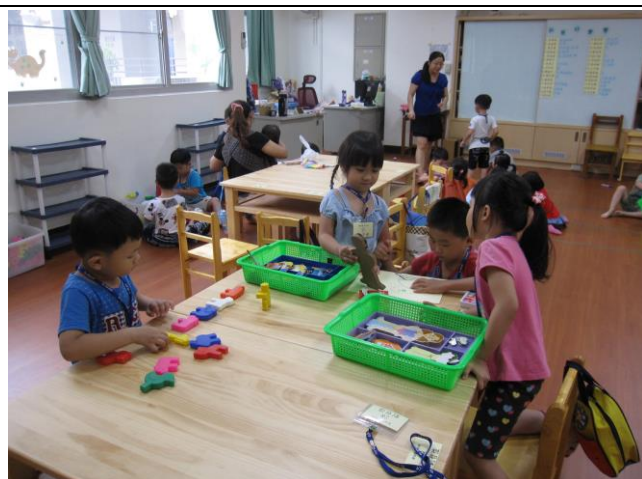
說明：佃中附設幼兒園—教學區域