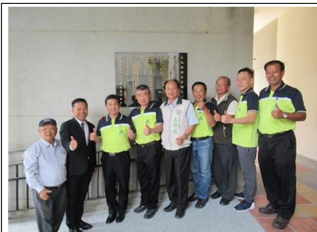
說明：單車車棚完工典禮