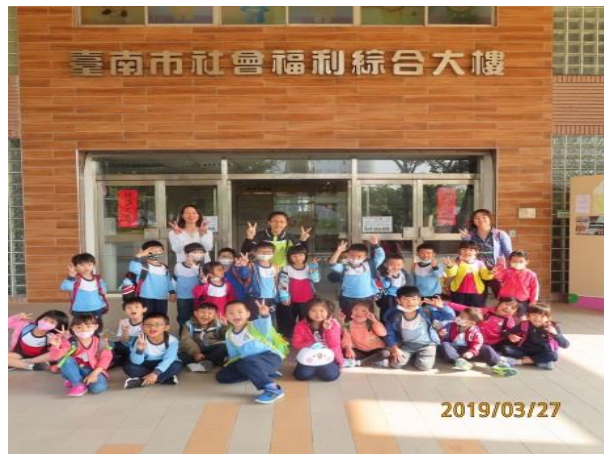
兒童福利中心 1 日遊-開心大合照