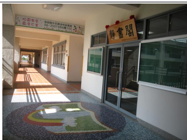
說明：圖書室改建後—圖書館正門