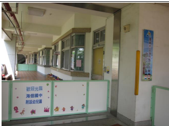
說明：佃中附設幼兒園—幼兒園景觀