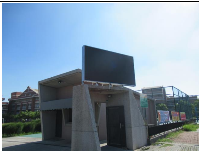
說明：LED 電視牆建置完成