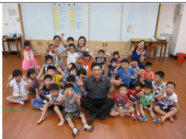
說明：佃中附設幼兒園一師生合照