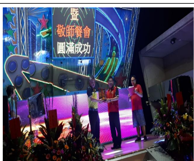
說明：108學年度敬師餐會暨家長會就職典禮