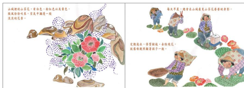
※範例作品：教育部反毒繪本—山茶花婆婆/洪孟真、呂舒婷