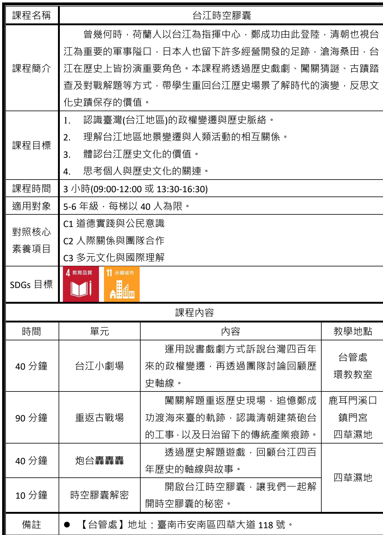
台江濕地學校《台江時空膠囊》教學方案簡表