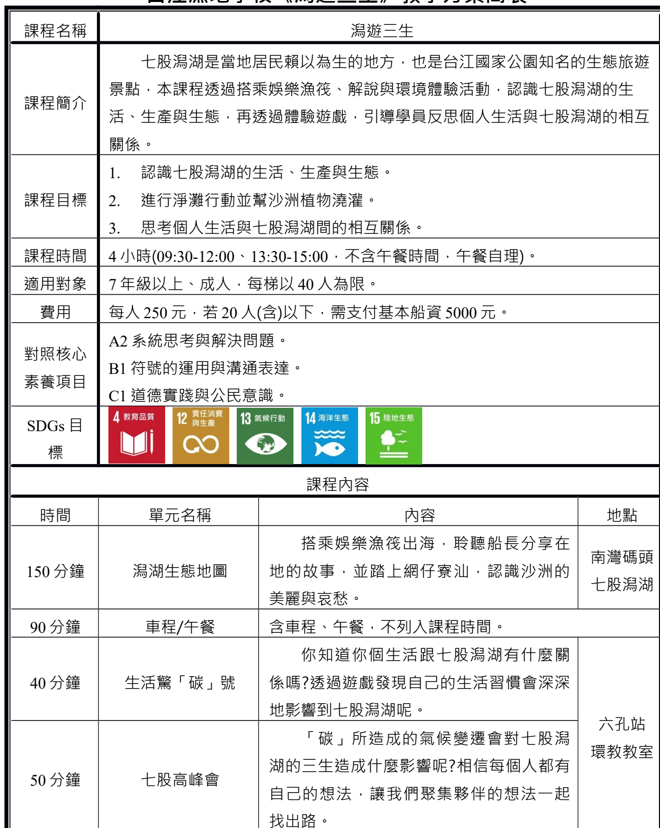
台江濕地學校《瀉遊三生》教學方案簡表