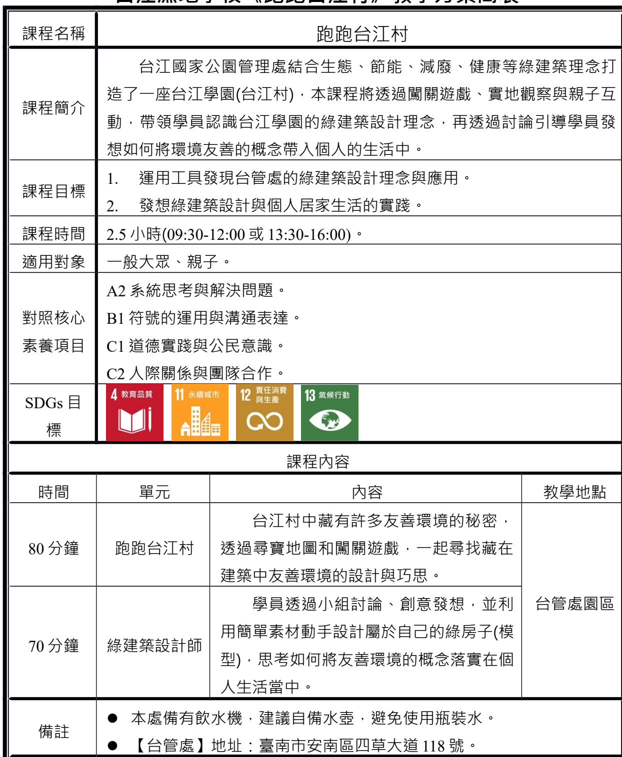
台江濕地學校《跑跑台江村》教學方案簡表