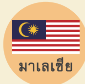
มาเลเซีย

ครูสอนภาษาผ่านการรับรอง อุปกรณ์การสอนครบครัน-ฟรี