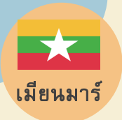
เมียนมาร์