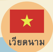
เวียดนาม