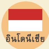
อินโดนีเซีย