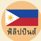
ฟิลิปปินส์