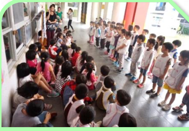
企鵝班跟我們分享神奇的蚯蚓