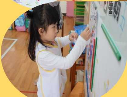
探索天氣與地理位置