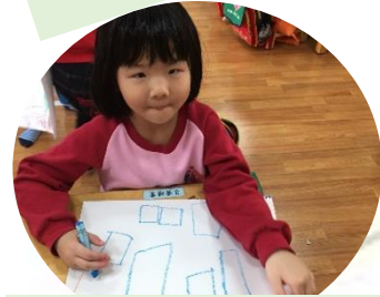
我負責把新材料記錄起來