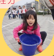
合力運送水，提升孩子 手部肌肉及專注力