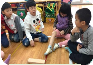
我們用木頭試試看吧！