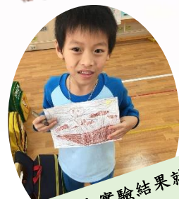
我畫下來實驗結果就不會忘記！