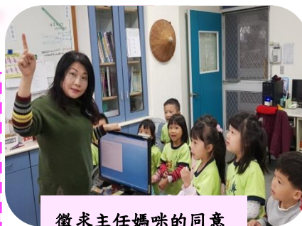
徵求主任媽咪的同意

我們本來想把房子蓋在國小的紅大象溜滑梯，可是主任媽咪幫我們問過國小老師，他們不答應，所以我們找呀找，改到直排輪那裏的樓梯下面，因為這樣就多出兩面牆壁也可以不用做屋頂，我們本來想買磚頭，但因為沒有錢，所以改用瓶子來蓋房子！