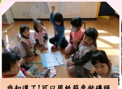
我知道了！可以用紙箱來做磚頭