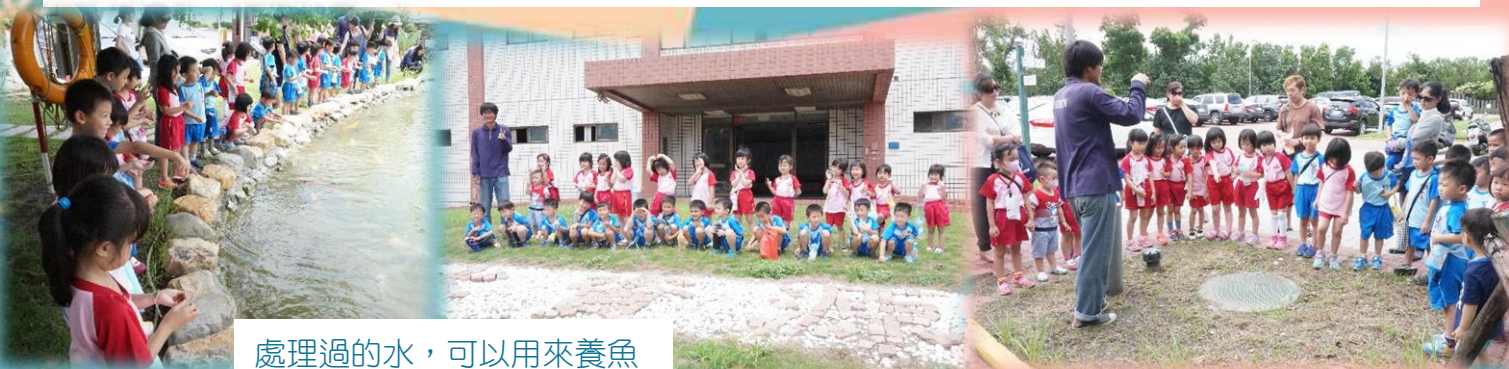
處理過的水，可以用來養魚