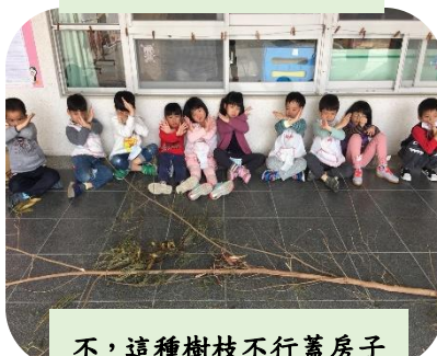
不，這種樹枝不行蓋房子