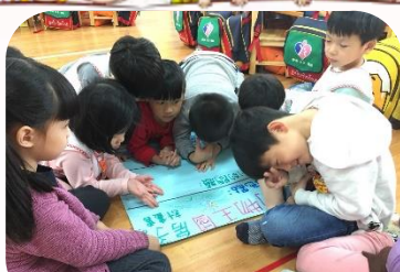
要用什麼材料來蓋房子呀？

我們到動物王國繞了一圈以後，決定把房子蓋在小山坡的樹下，因為太靠近動物王國會被其他人撞到，本來我們想用磚頭蓋，但是要花9千多元，所以想要砍樹蓋房子，但是細細的樹就要8千元，所以我們改用紙箱和去回收場撿到的樹枝來蓋房子！