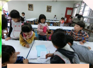
我們這組要叫甚麼名字呢？