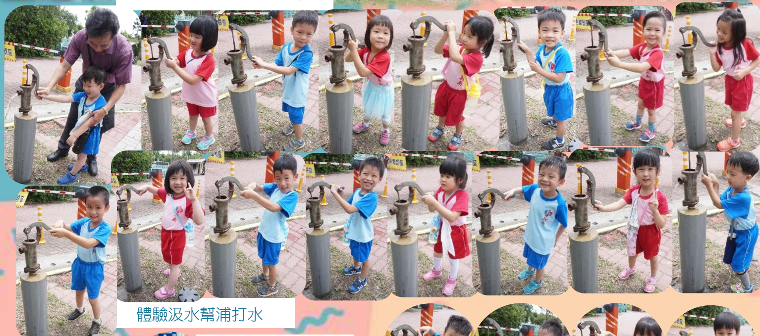
體驗汲水幫浦打水