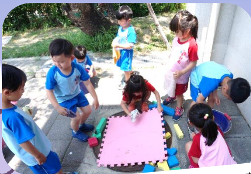
拆掉與清理舊水庫