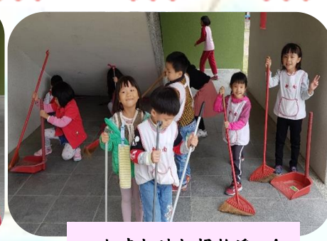
一起來把地板掃乾淨吧！