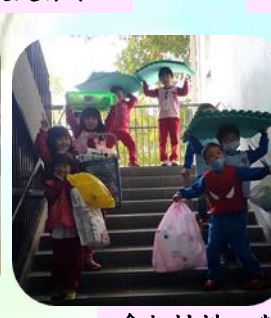
拿起材料，我們要來蓋房子了！