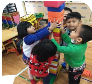
用大積木來排排看要蓋多大！