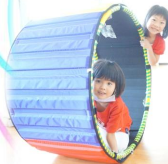
雙手手臂力量練習 滾大圈