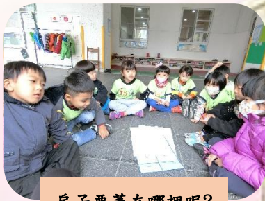
房子要蓋在哪裡呢？

我們決定把房子蓋在辦公室外面，因為旁邊多了一面牆壁比較不容易倒，經過密集的討論，孩子堅持需要磚頭來蓋房子，但因為教室沒有磚頭，外面買也需要花一筆經費，所以最後孩子們決定用紙箱製作成磚頭來蓋房子。