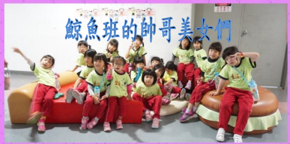
鯨魚班的帥哥美女們