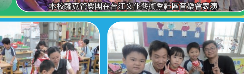
透過親子共同製作母親節珠寶盒的活動，更增加了親子間的親密情感。