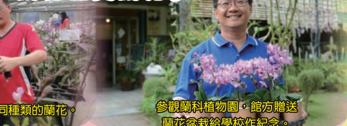
參觀蘭科植物園，欣賞各樣不同種類的蘭花。