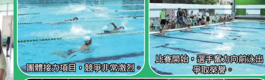
團體接力項目，競爭非常激烈。