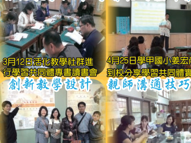
3月12日活化教學社群進行學習共同體專書讀書會 創新教學設計