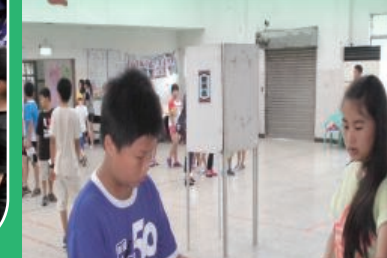
小市長選舉活動學生投下自己神聖的一票