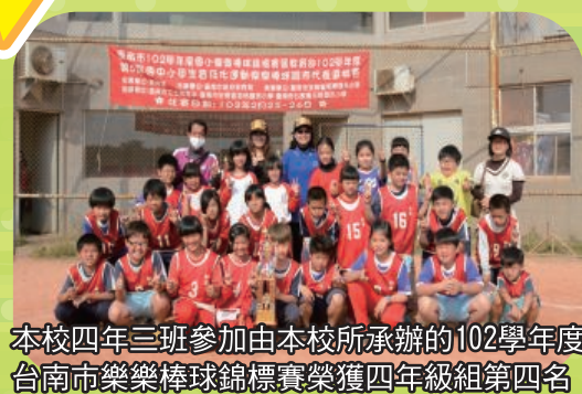
本校四年三班參加由本校所承辦的102學年度台南市樂樂棒球錦標賽榮獲四年級組第四名