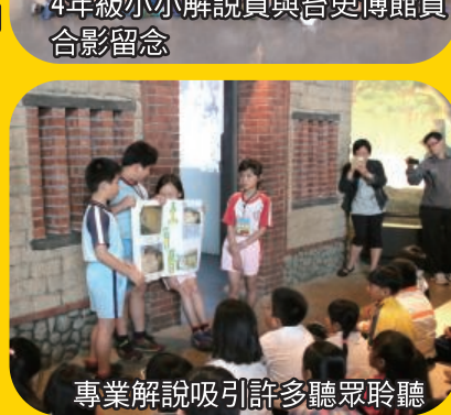
4年級小小解說員與台史博館員合影留念