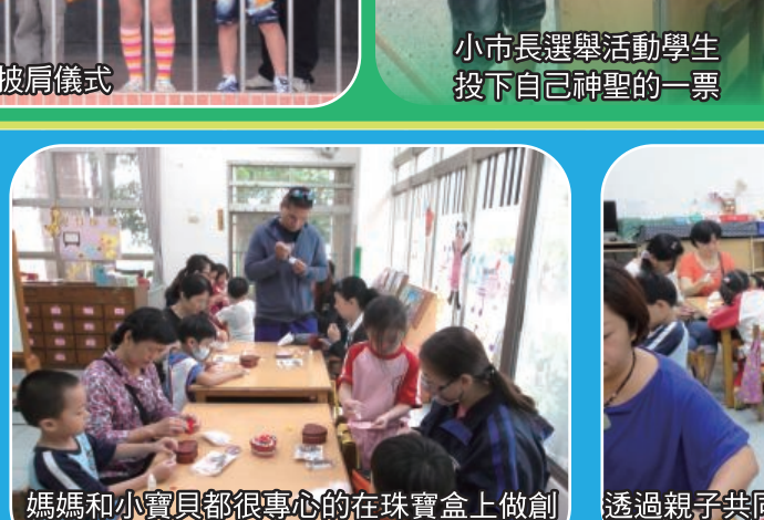
廣達游於藝創教案設計研討