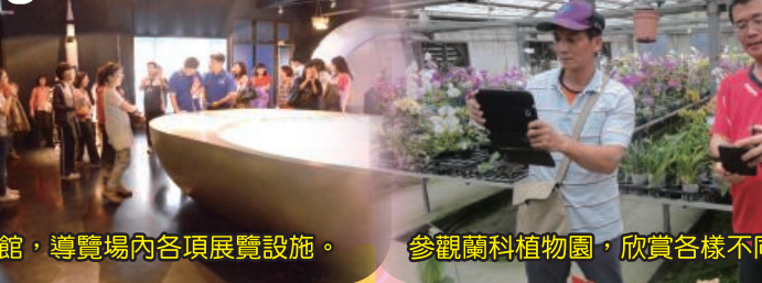
參觀南瀛天文館，導覽場內各項展覽設施。