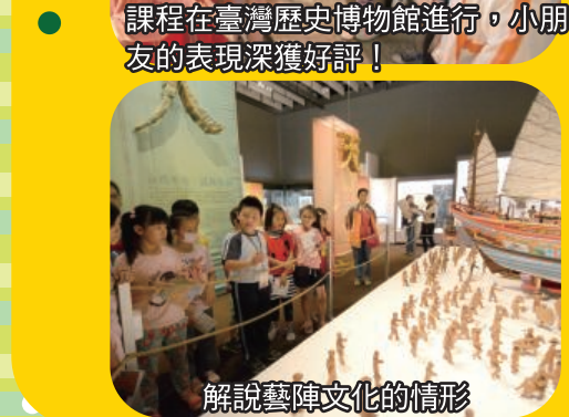
「發現小小解說員」四年級博物館課程在臺灣歷史博物館進行，小朋友的表現深獲好評！