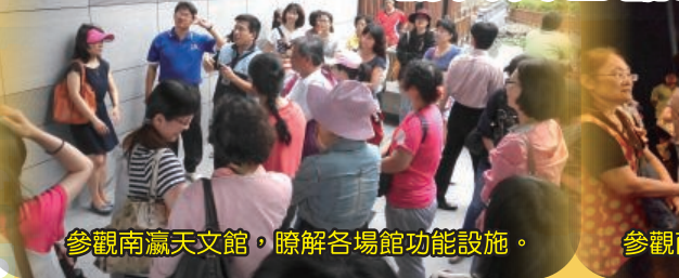
參觀南瀛天文館，瞭解各場館功能設施。