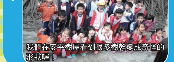
安平古蹟&防災教育館校外教學