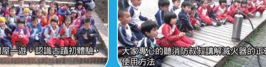
大家專心的聽消防叔叔講滅火器的正確使用方法