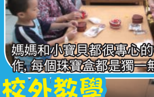
我們的爸爸很用心的和寶貝們創作珠寶盒送給媽媽囉！