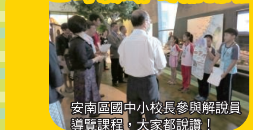
安南區國中小校長參與解說員導覽課程，大家都讚賞！