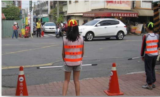
<前門安和路口>交通管制，車停兩側