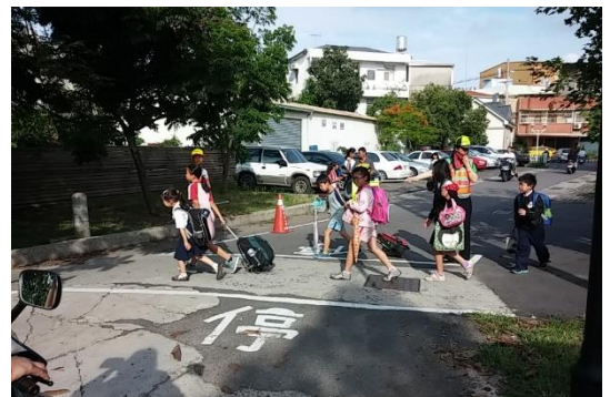
<州北活動中心>到校園通道(行人優先)