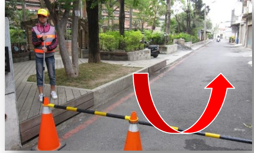
<前門旁>騎機車家長在此讓學生下車上學 (迴轉)