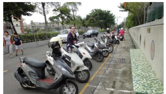
<後門>汽機車停後門兩側，供學生上下車上學