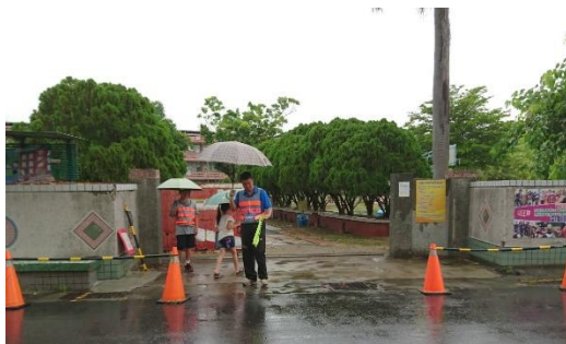
<後門>導護管制，請勿停車。