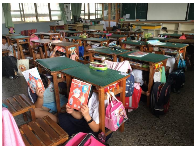
師生趴下、掩護、穩住