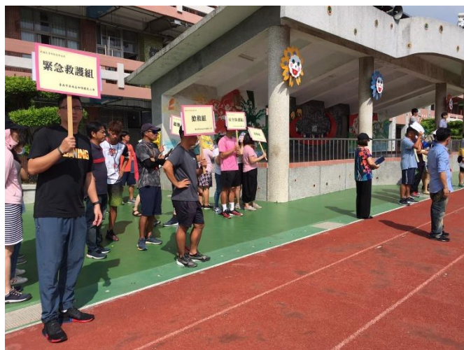
學校啟動緊急應變組織