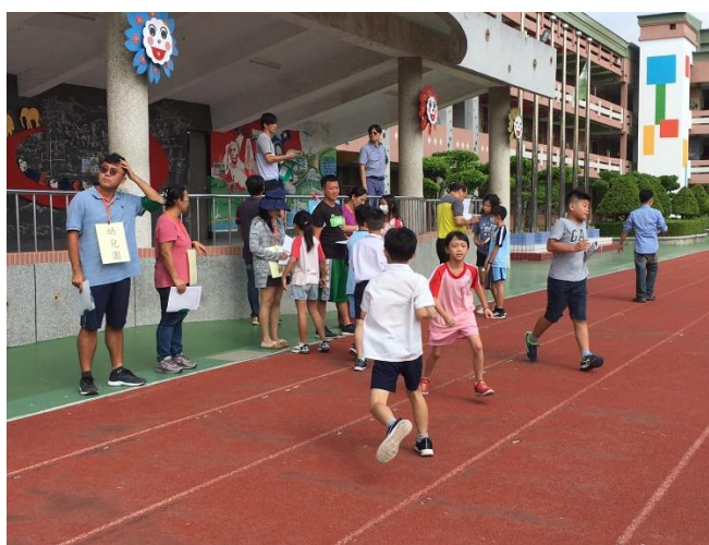
師生避難集結清點人數