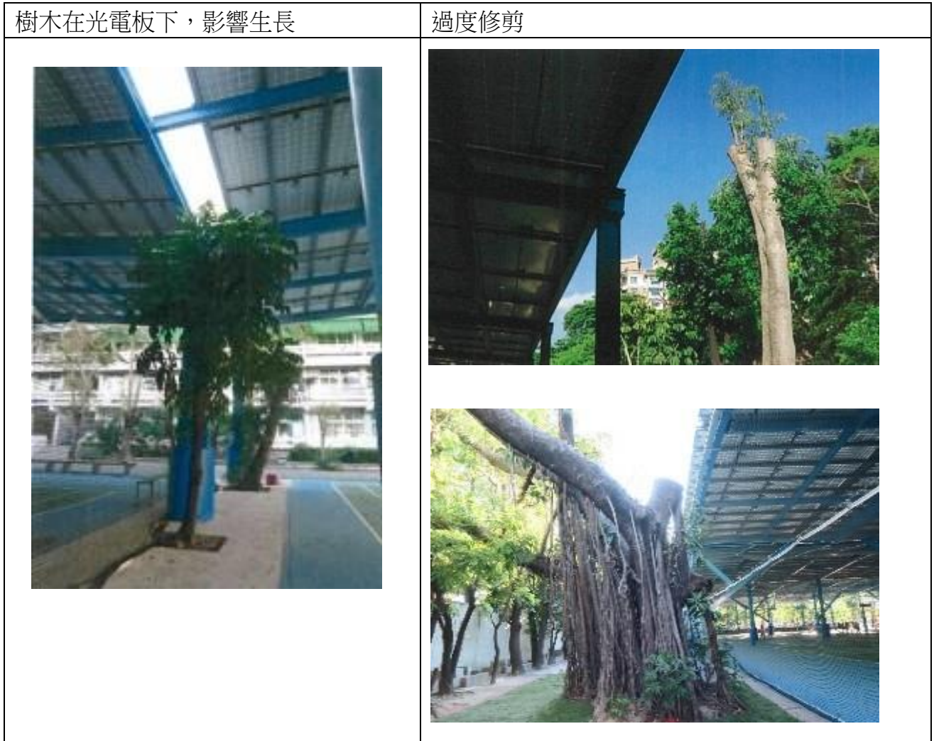
附表 2-7 不利於校園樹木生長案例