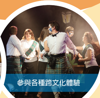
參與各種跨文化體驗

聯絡方式: ☎ 0909 068 077 @ logoshope.anping@gbaships.org