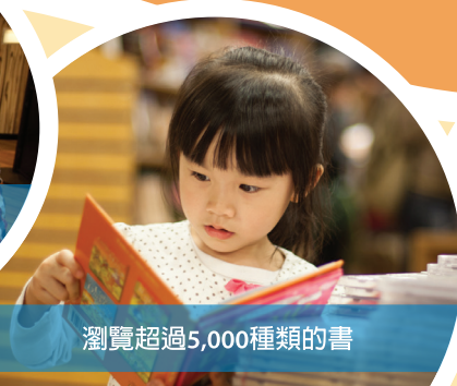
瀏覽超過5,000種類的書