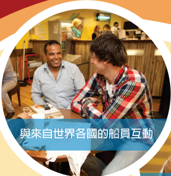
與來自世界各國的船員互動

Children under 12 years old enter for FREE (must accompanied by an adult)