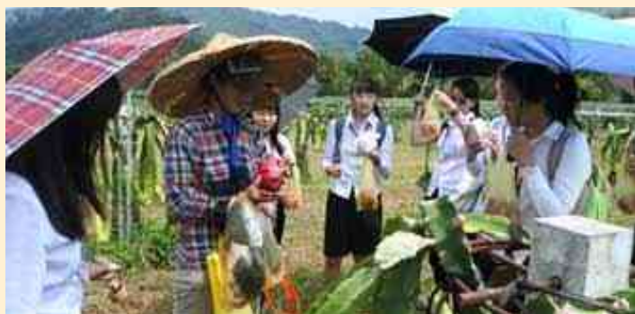
學生手中拿的是「火龍果」。