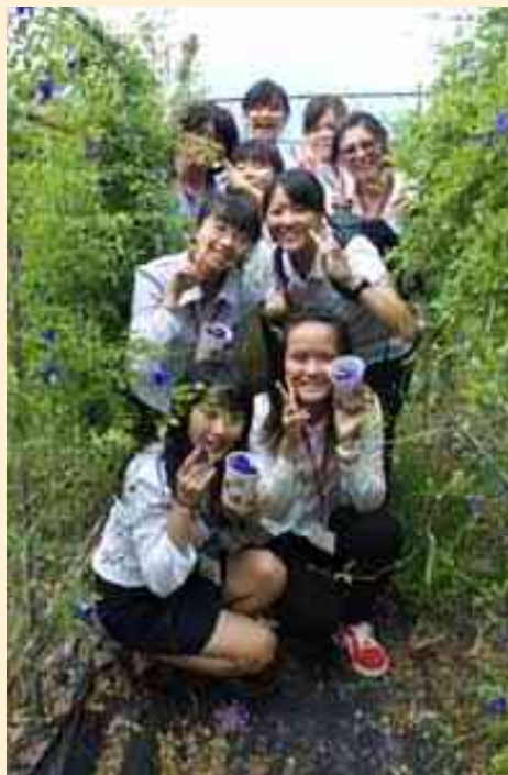
學生手中拿的是「蝶豆花」。