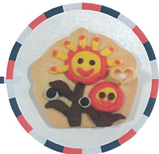
媽媽是溫暖的太陽