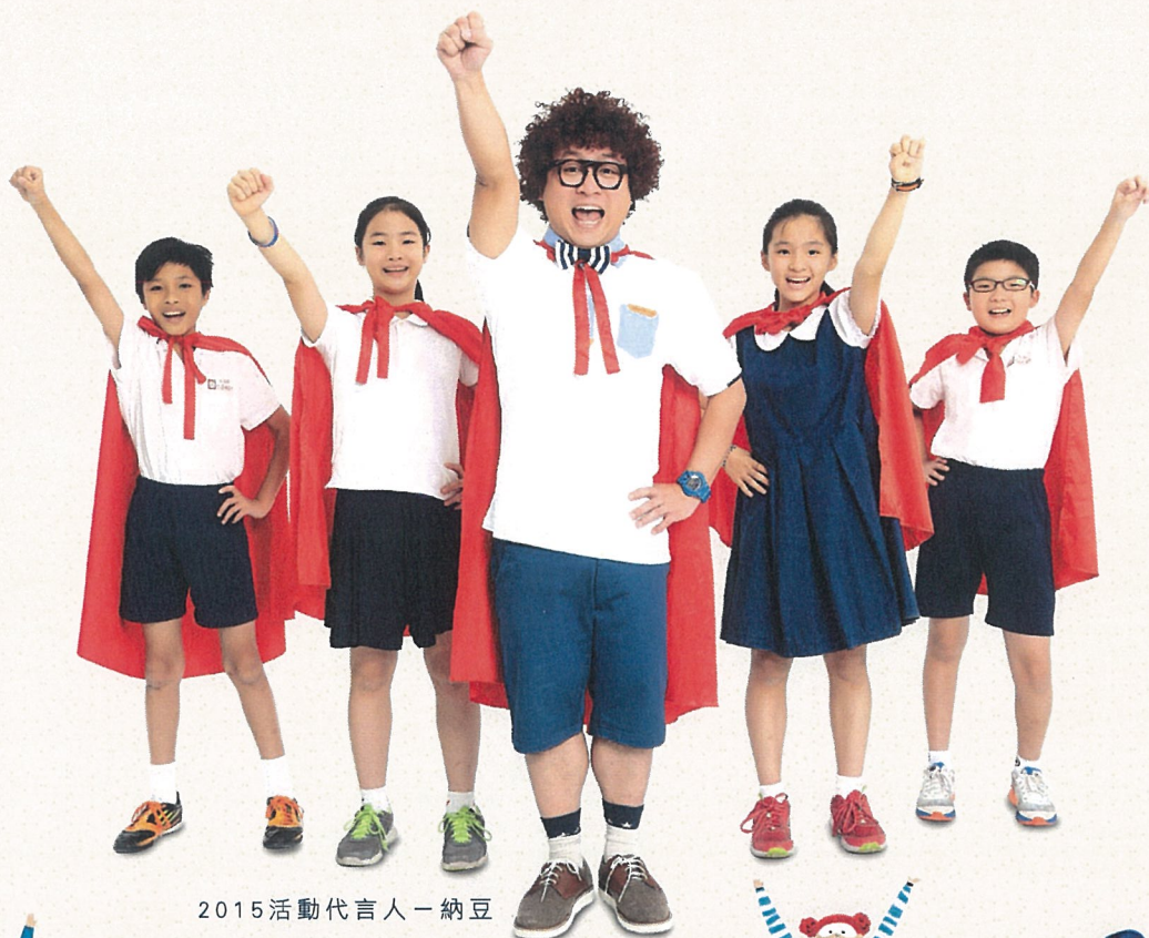
2015 活動代言人 - 納豆