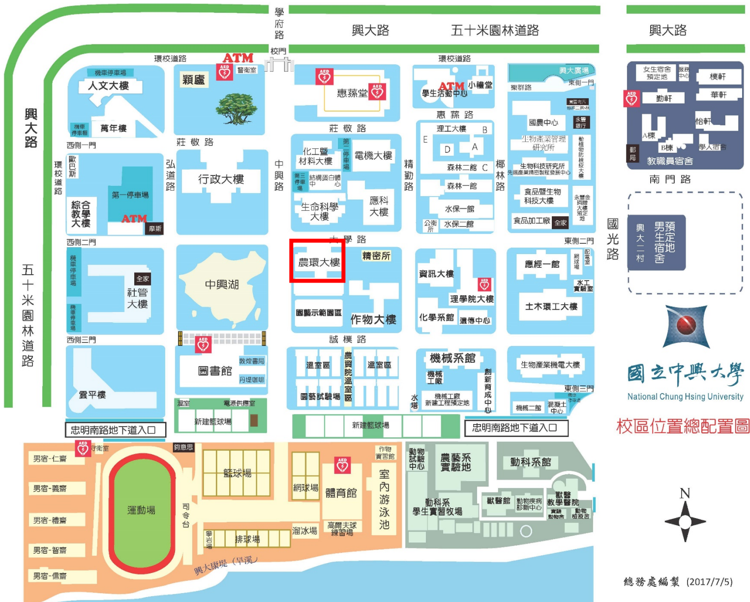
校區位置總配置圖