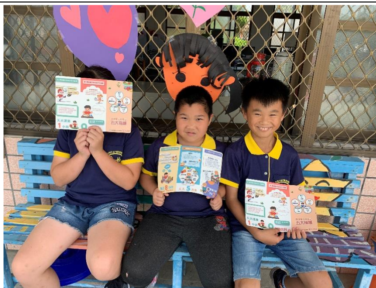
照片 2.說明:85210 宣導墊板。