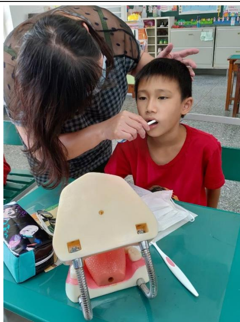
照片 2. 說明：檢視學生刷牙的死角，並給予協助。