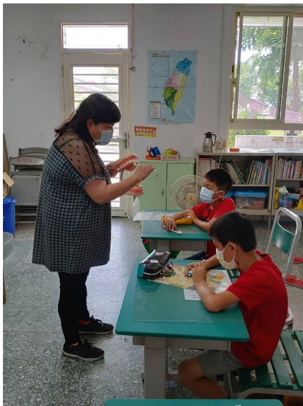
照片 1. 說明：由護理師說明如何正確刷牙。