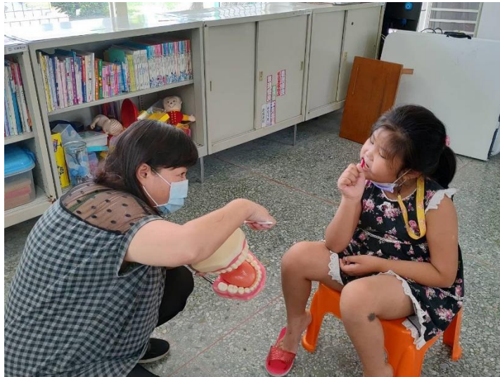
照片 2. 說明：檢視學生刷牙情形