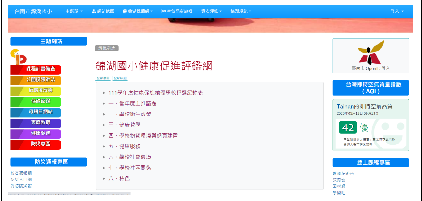
照片 1.說明:學校網站提供健康促進計畫及活動成果。