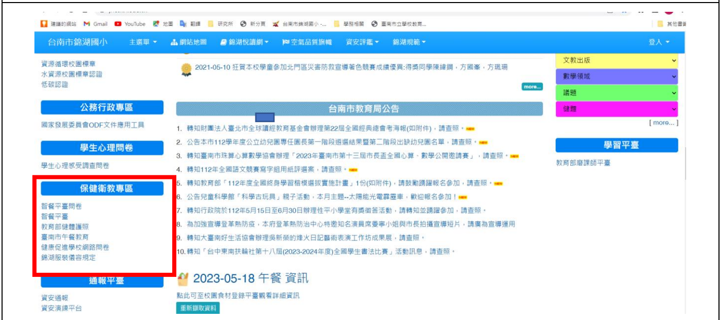
照片 2.說明:紅色框框為學校網站所提供相關衛教資訊。