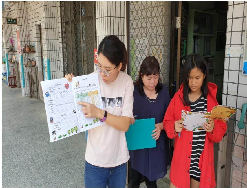
照片 3.說明:推廣健康護照。