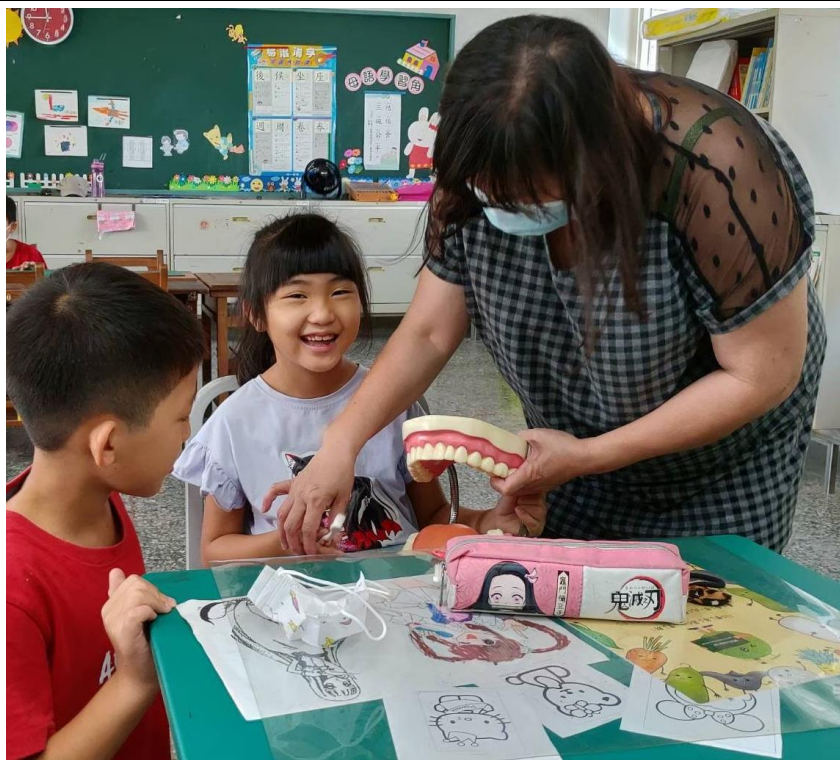
照片 2. 說明：以牙齒模型引導學生正確刷牙。