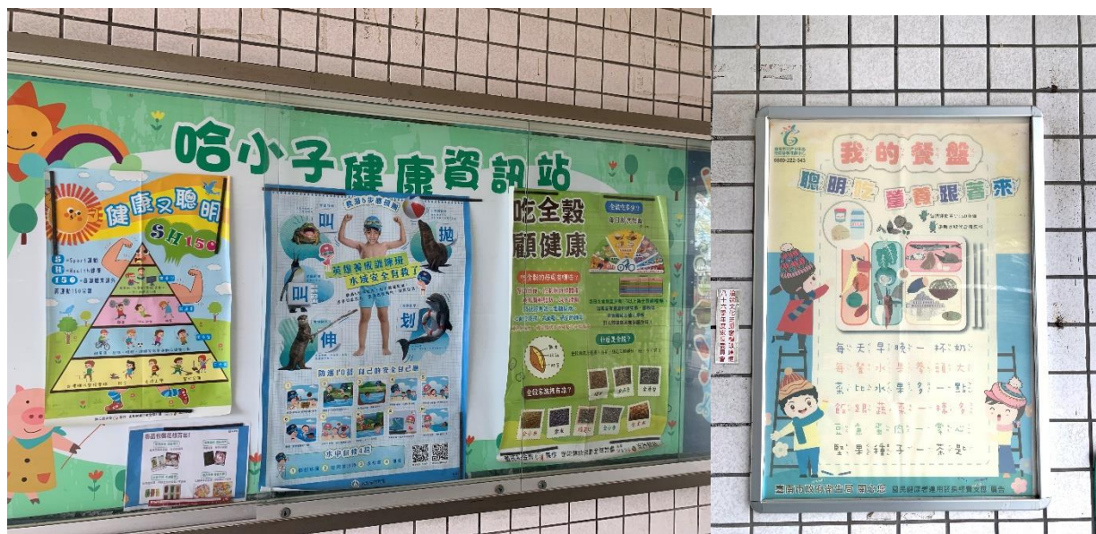
照片 1.說明:公佈欄張貼健康促進等相關資訊