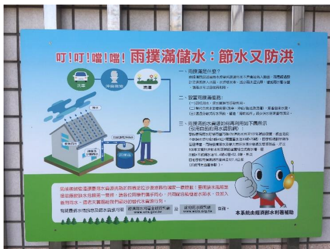
照片 2. 說明：學生利用雨水澆花、拖地，節水又防洪