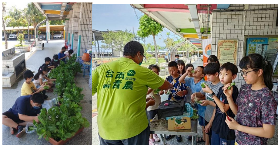
照片 3. 說明：採收試吃種植成果