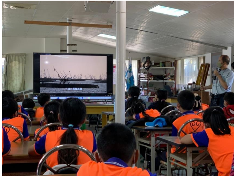
照片 3. 說明: 觀賞生態影片