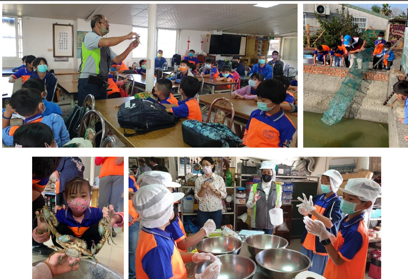
照片 2. 說明：與北門區的臺南生態旅遊協會合作進行生態課程