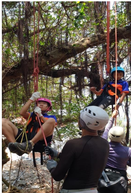
說明：繩結及攀樹教學