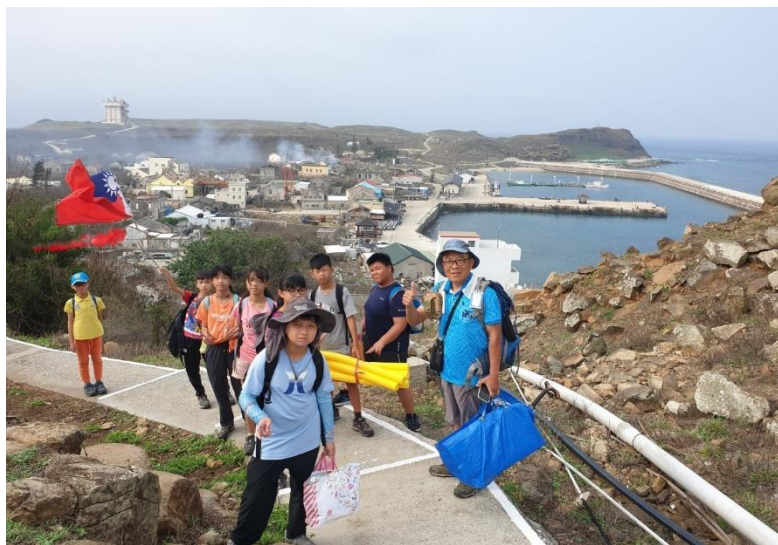
說明：結束東吉嶼海洋教育之旅