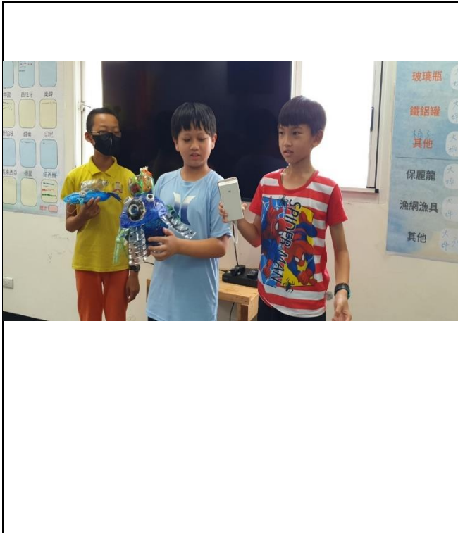
說明：利用海廢進行創作