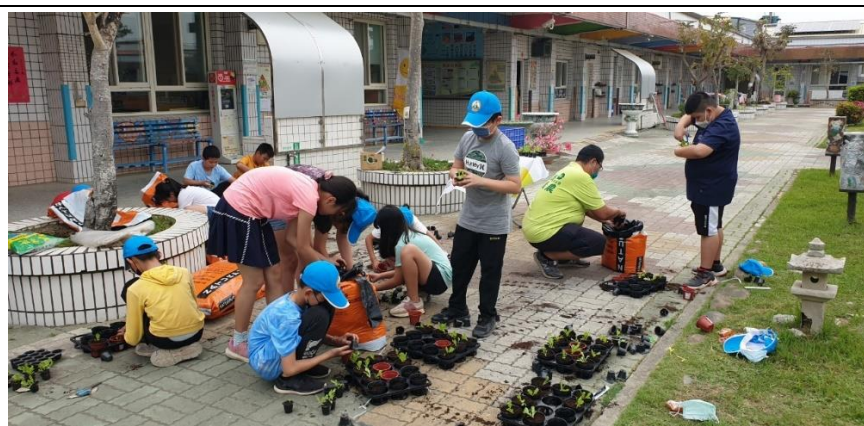
照片 2. 說明：種植蘿蔓與大陸妹