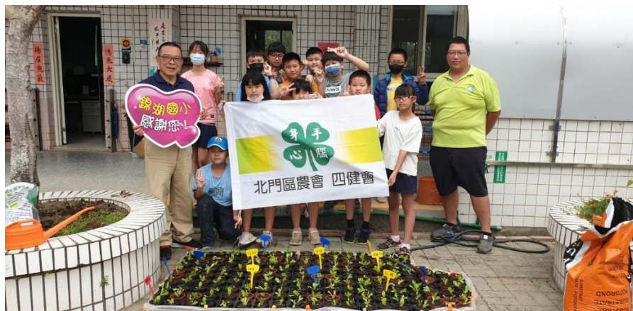
照片 1. 說明：北門農會-四健會到校進行食農教育