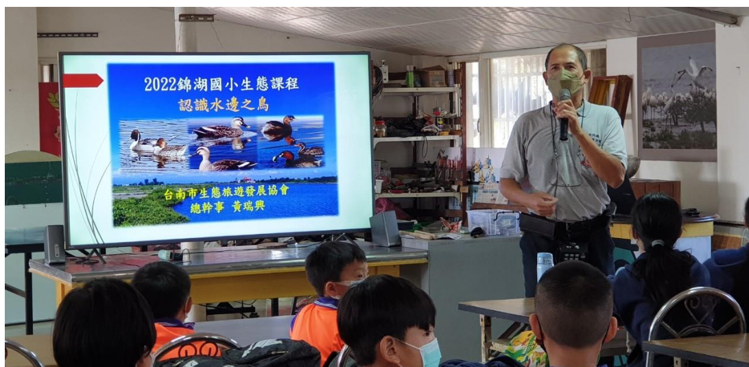
照片 1. 說明：與北門區的臺南生態旅遊協會合作進行生態課程