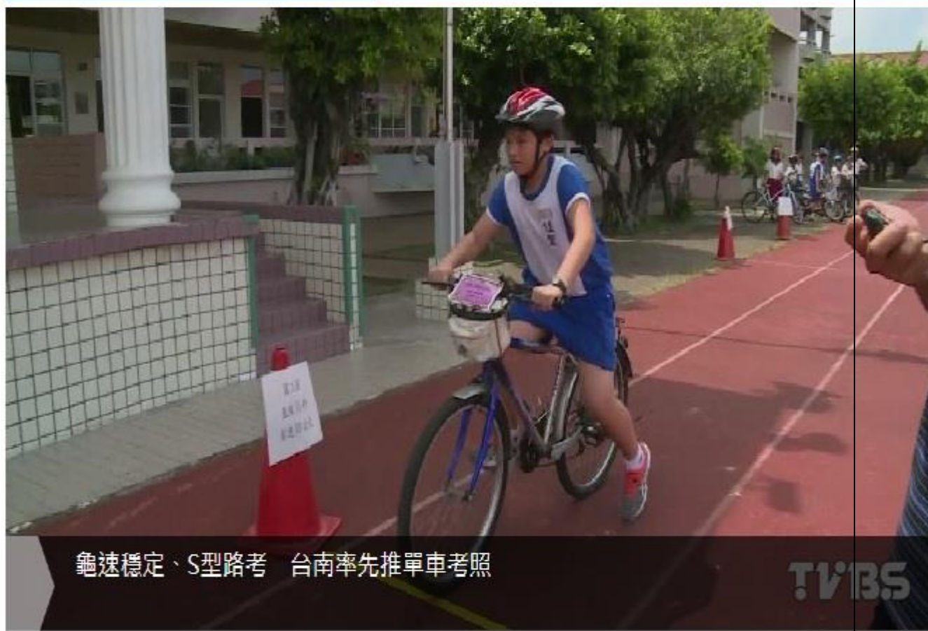
龜速穩定、S型路考 台南率先推單車考照