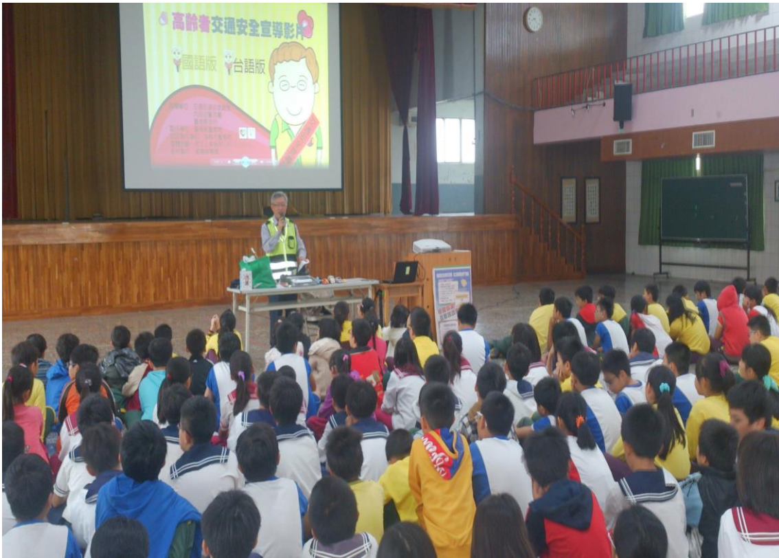
說明：邀請佳里分局交通隊長到校演講