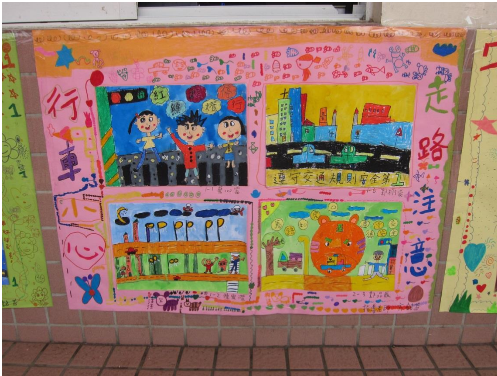
說明：利用運動會張貼交通安全海報向民眾宣導 4