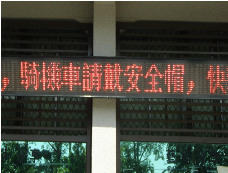
說明：跑馬燈宣導交通安全—騎車請戴安全帽