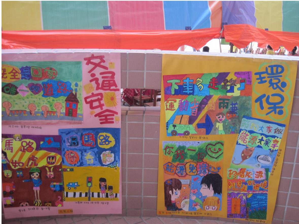
說明：利用運動會張貼交通安全海報向民眾宣導 2