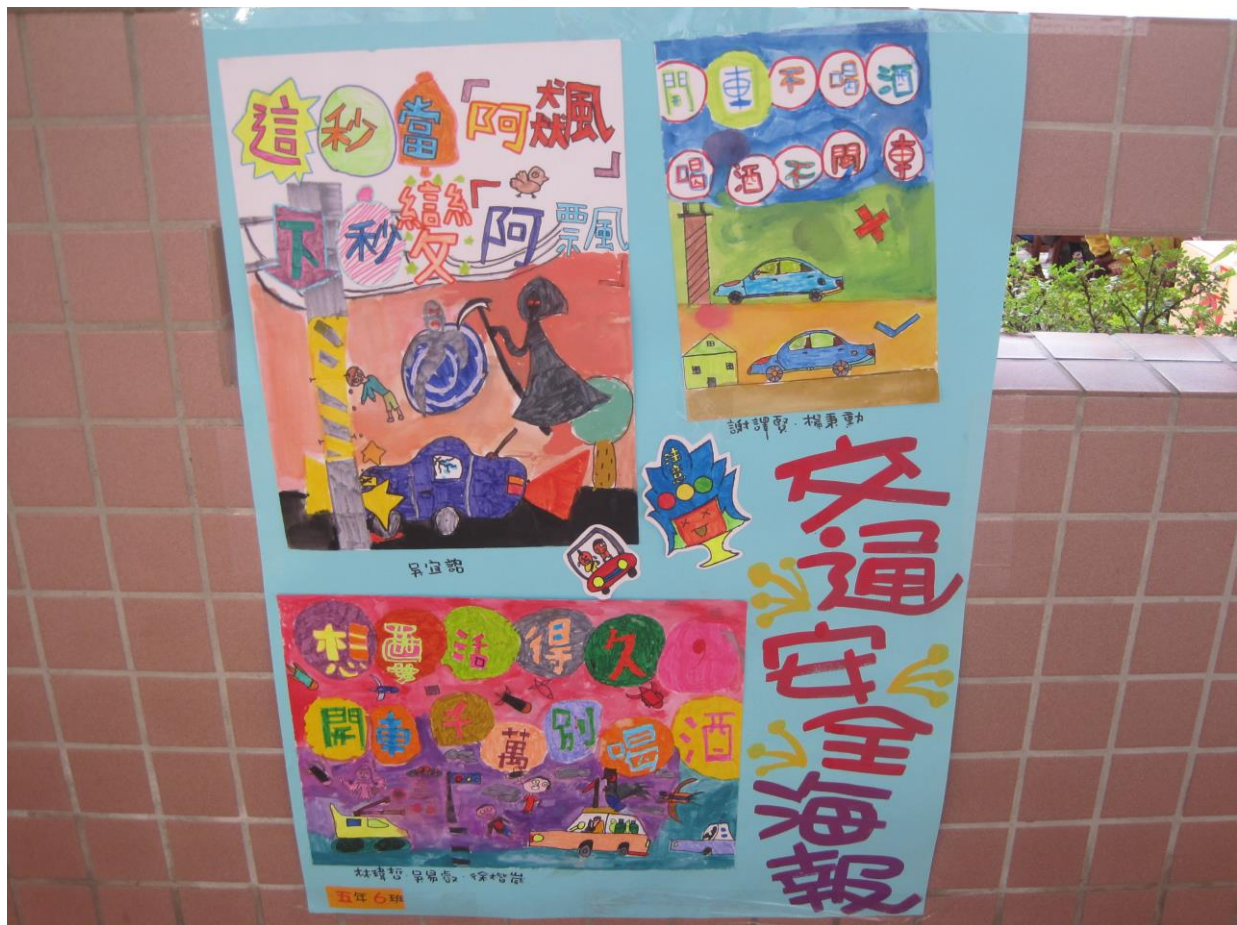
說明：利用運動會張貼交通安全海報向民眾宣導 1