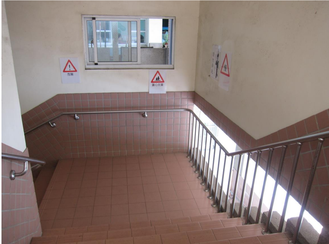
說明：張貼各種常見的交通號誌，加深民眾及學生的印象