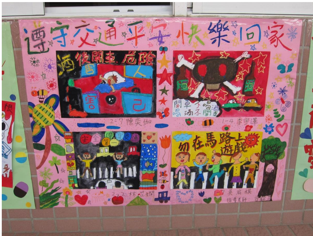
說明：利用運動會張貼交通安全海報向民眾宣導 3