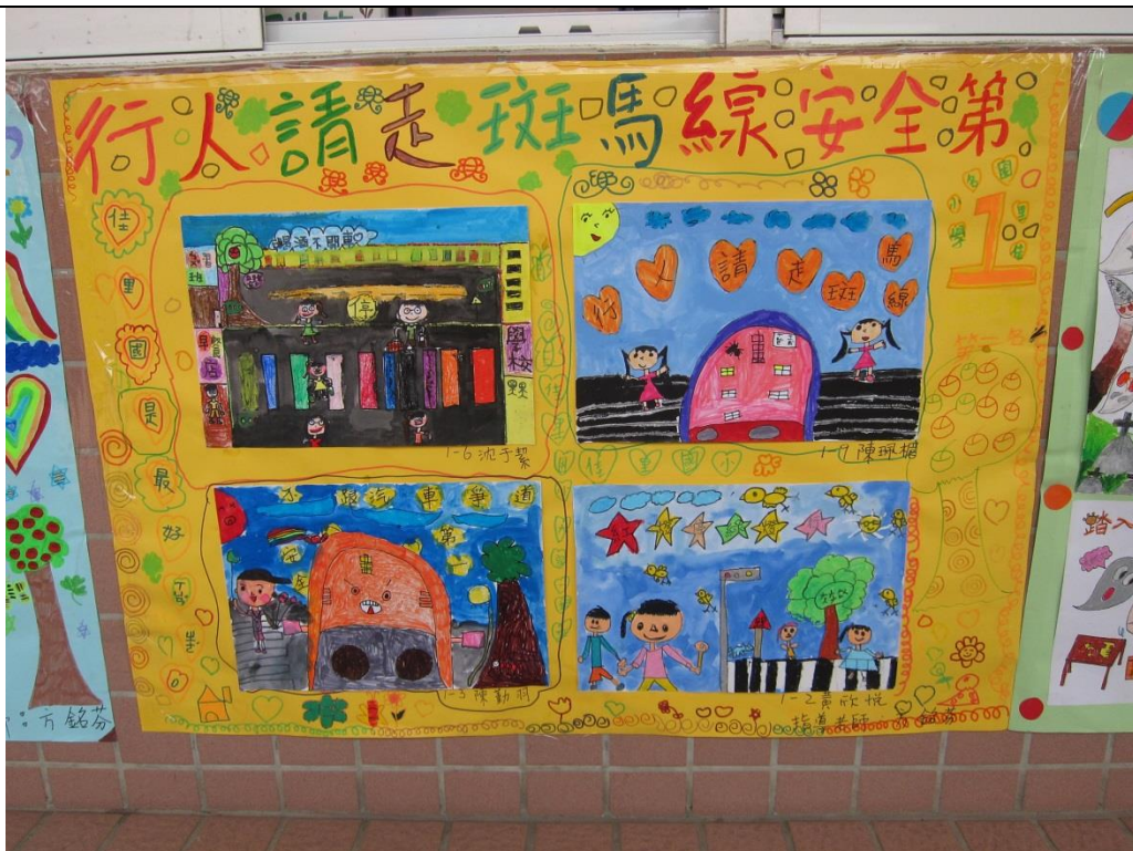
說明：利用運動會張貼交通安全海報向民眾宣導 5