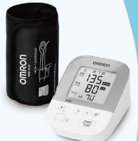
藍牙電子血壓計3名