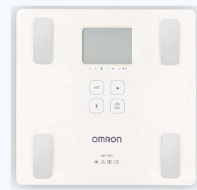
藍牙體重體脂計3名