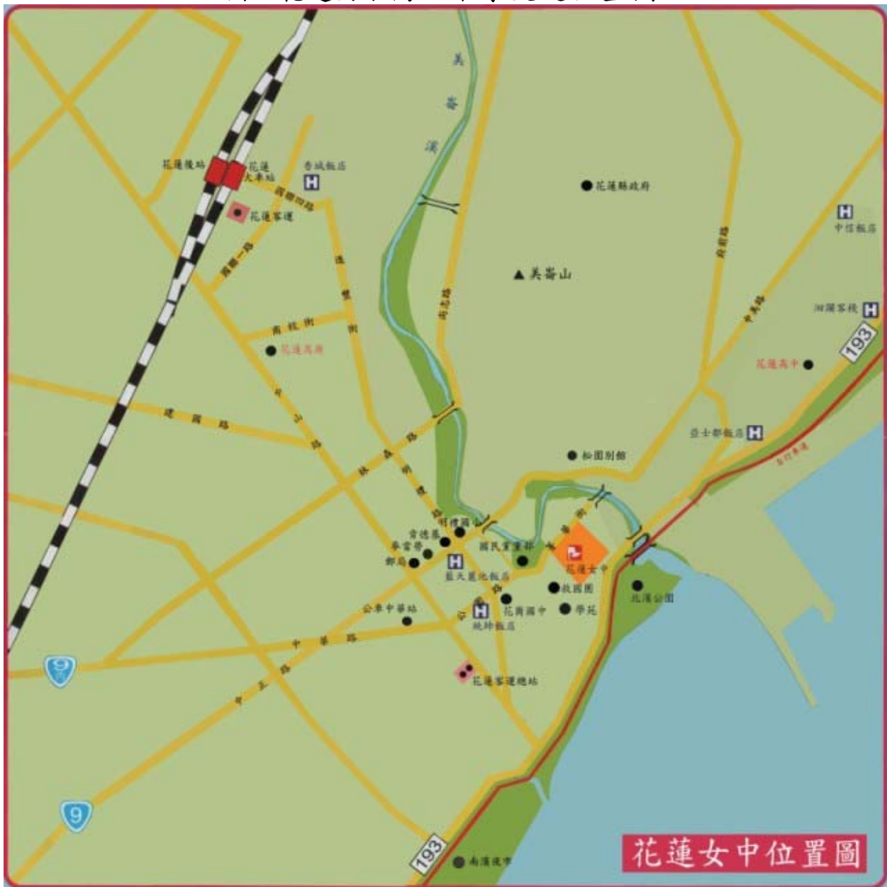
國立花蓮女子高級中學交通位置圖