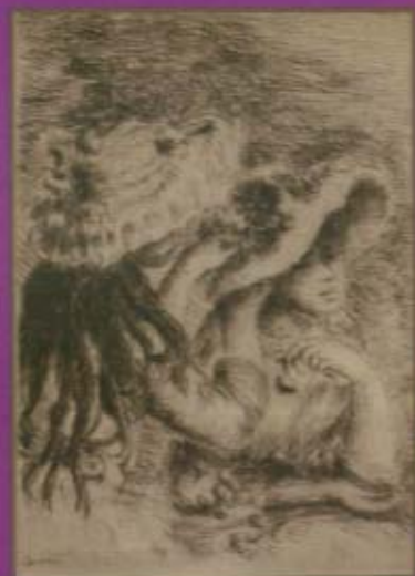
雷諾瓦Pierre Auguste Renoir 調整帽子的少女 Le Chapeau Epingle 法國/十九世紀 蝕刺/1893 8 X 12 cm