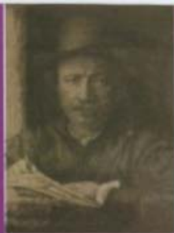
林布蘭Rembrandt 在窗邊之自畫像 Self-Portrait by the Window 荷蘭/十七世紀 蝕版，五版之三 (3rd of 5 states, 1640) 15, 9 X 12, 5cm