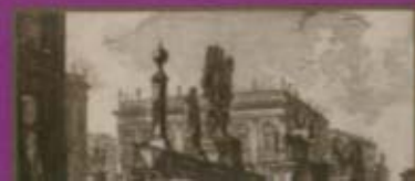
皮拉內西Giovanni Piranesi 古羅馬一景 Veduta del Campidoglio di Fianco 義大利/十八世紀