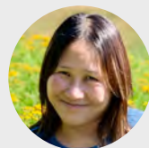
哈佛 Project Zero 計畫主持人 Flossie Chua

雙橡教育 始終相信學習是有用、有趣、有意義的事，它能讓人找到安身立命的工作，有能力打造自己的未來。雙橡自 2017 年起，開始往芬蘭、哈佛取經，打造出許多結合東西方特色的專案課程，因而獲親子天下創新 100，並啟動多個社會影響力活動，包含 See Think Wonder 思考挑戰賽 。