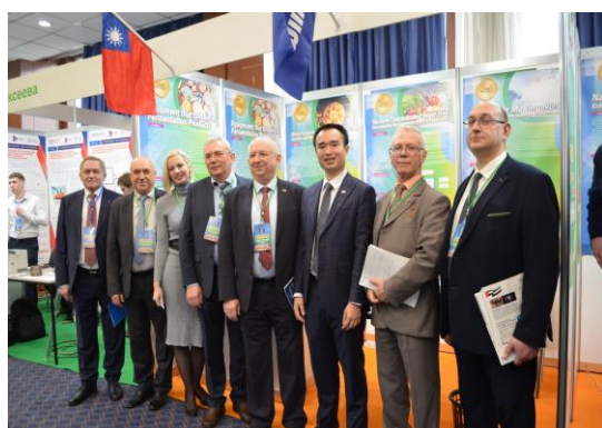
▲ 當地廠商蒞臨台灣展區洽談合作