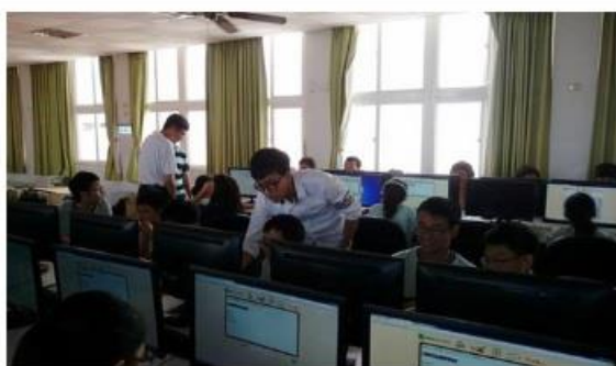
昭明國中學生參與英文單字聽力練習雲端知識庫建置計畫