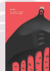
致。自由 學生組佳作 廖建凱

1984年，聯合國通過《禁止酷刑及其他殘忍不人道或有辱人格之待遇或處罰公約》（簡稱「禁酷公約」），截至目前為止已有173個國家加入批准，未來期許禁酷公約施行法草案儘快在立法院審議通過，杜絕各種形式的酷刑及虐待在台灣發生。