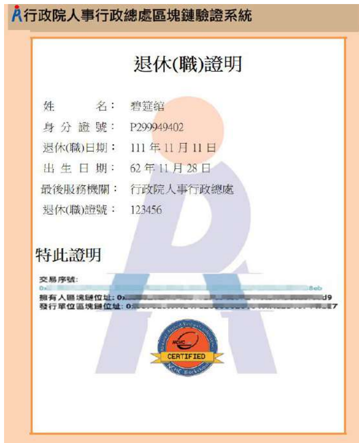
圖 10 區塊鏈驗證測試圖樣(範例)