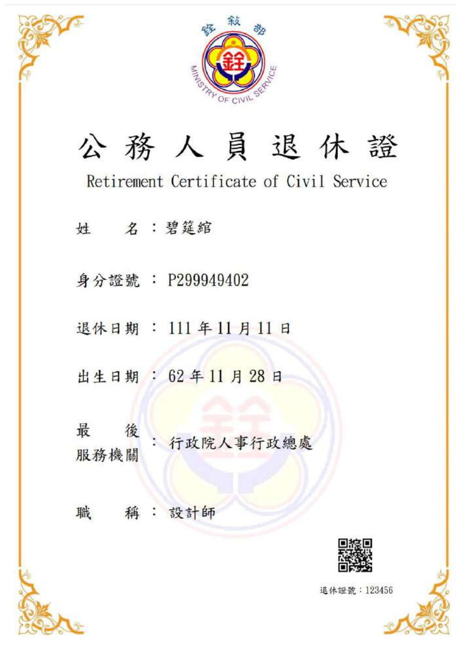
圖 8 公務人員退休證測試圖樣(範例)