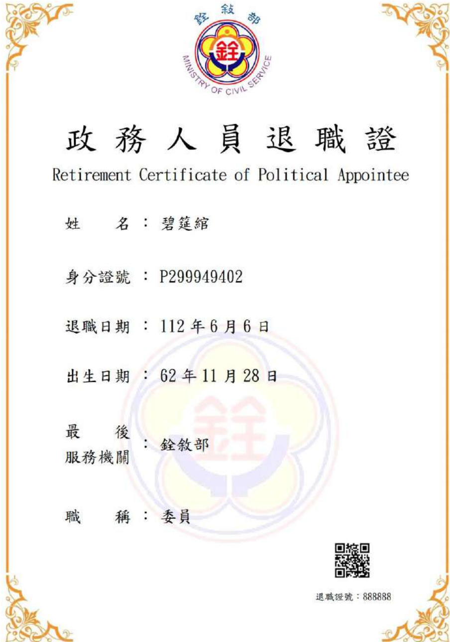
圖 9 政務人員退職證測試圖樣(範例)