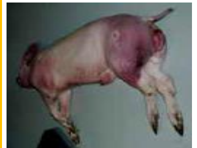
圖：皮下出血及血便