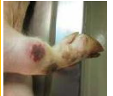
圖：關節腫脹伴隨皮膚壞死