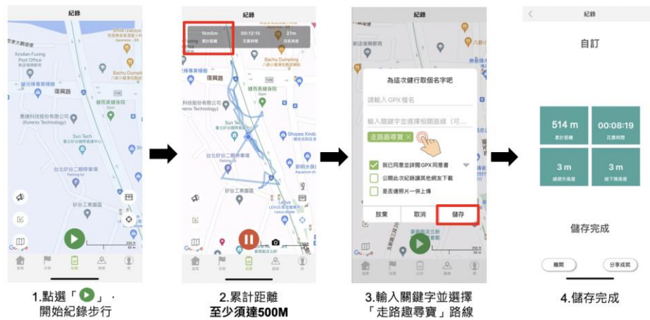
圖 3、iOS 系統流程說明

進入「健行筆記 App」後，點選「紀錄」開始步行，累計至少 500 公尺步行距離後，結束時自訂 GPX 檔名並於相關路線輸入關鍵字選擇「走路趣尋寶」路線，點擊儲存後即可獲得抽獎機會。