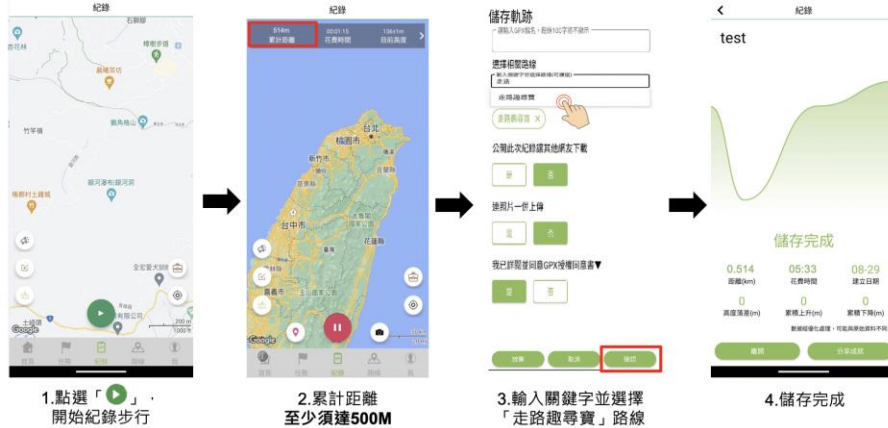
圖 4、Android 系統流程說明