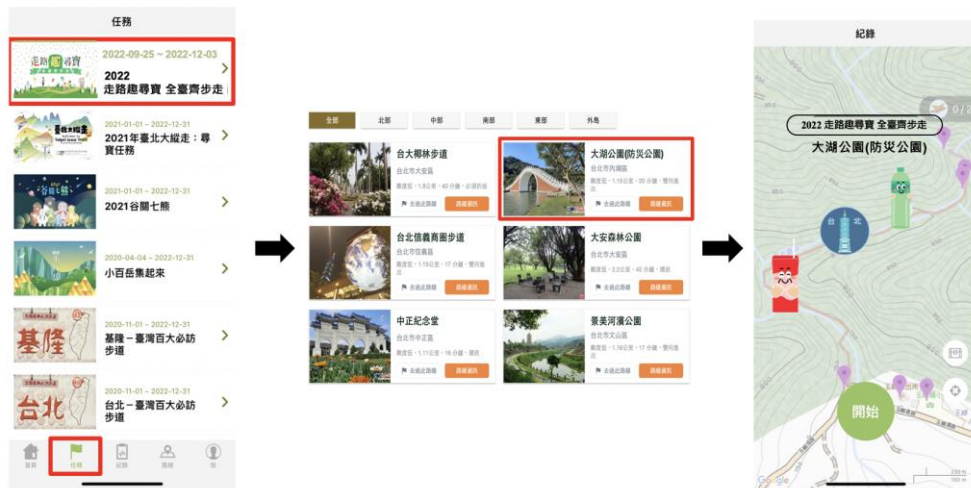
圖 4、全台地區尋寶步道