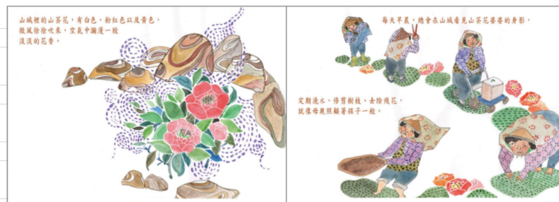
※範例作品：教育部反毒繪本—山茶花婆婆/洪孟真、呂舒婷