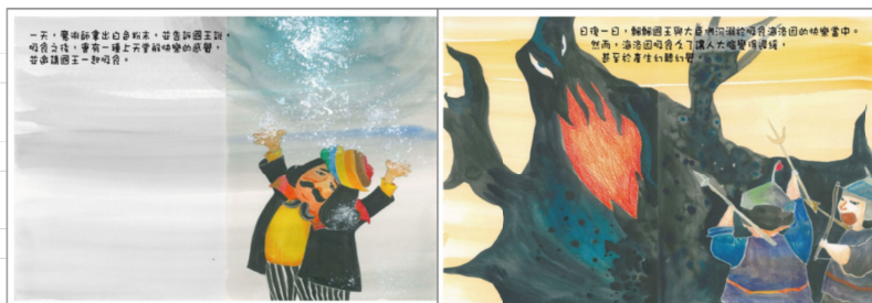
※範例作品：教育部反毒繪本—飄飄王國滅亡記/洪孟真、呂舒婷