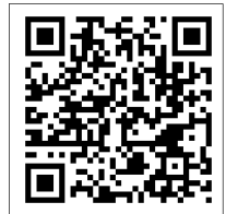
手機掃瞄 QR Code 可直接連上交通資訊頁面

二、檢附汽、機車、火車及高鐵、公車交通路線圖供參，或請掃描下方QRcode，直接連上本中心網站查詢交通資訊。