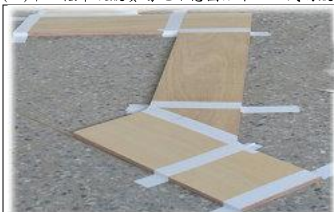
低年級競賽場地示意圖(3 段 2 彎)

(一)中、低年級競賽場地示意圖如下：正式的競賽場地組合於競賽當天 9：00 公佈。