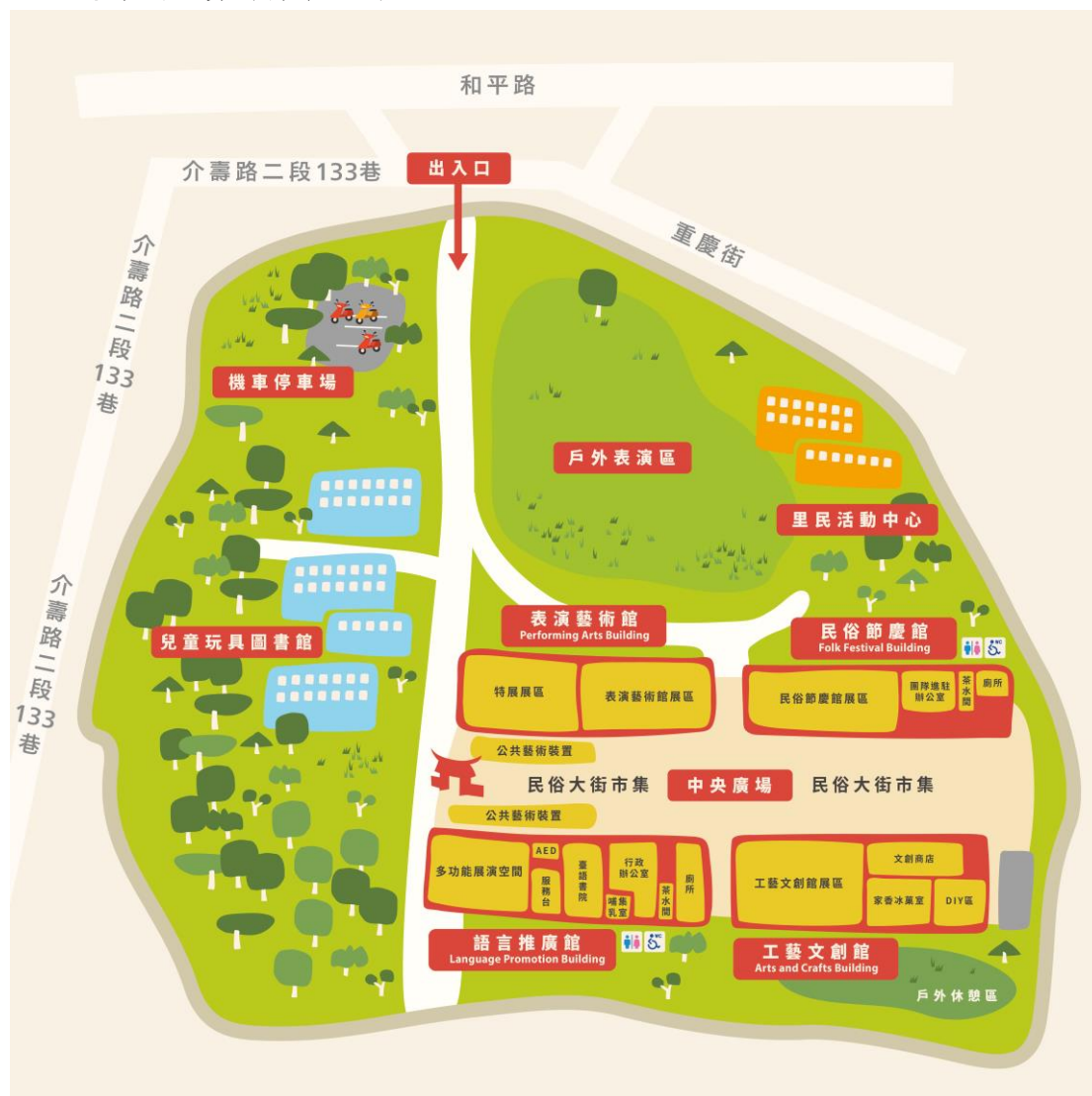
▼八塊厝民俗藝術村平面圖