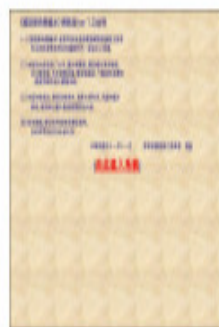
教育部國語辭典簡編本