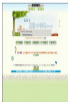
教育部國語小辭典