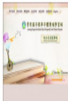
教育部常用國字標準字體 筆順學習網