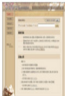
台灣閩南語常用詞辭典