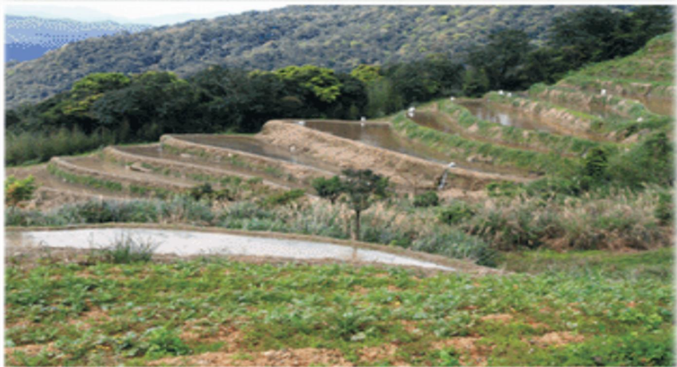
1 新北市 貢寮區的水梯田。

https://www.youtube.com/watch?v=jKuNF3xYfE