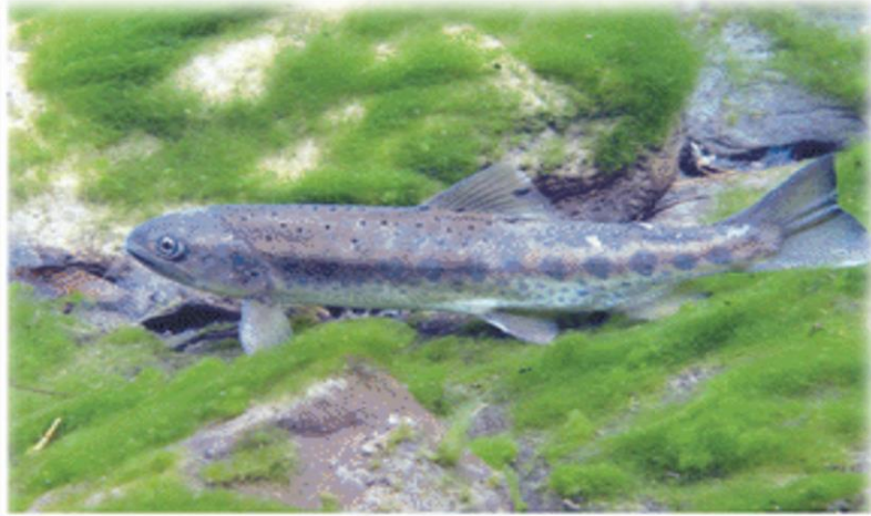
4 櫻花鉤吻鮭棲息在溫度低的乾淨溪流。