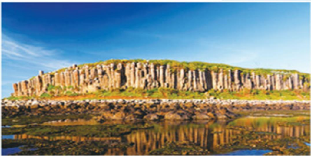
柱狀玄武岩地質、海洋珊瑚礁、菜宅等資源。