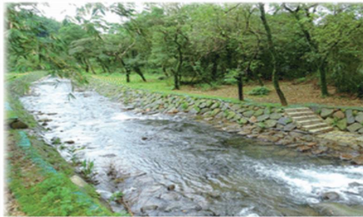
5 新北市金山區重和溪水源自陽明山國家公園，在地民眾持續封溪護魚。