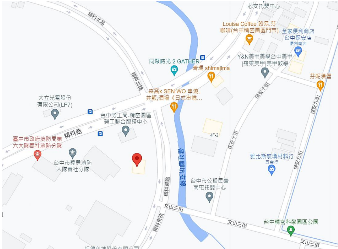
交通資訊