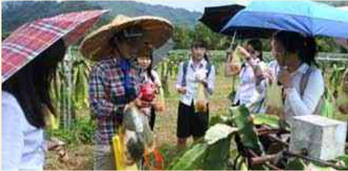
學生手中拿的是「火龍果」。