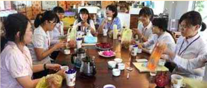
學生在農場摘的「火龍果」、「蝶豆花」，可製成「火龍果冰淇淋」、「蝶豆花茶」（如圖示桌面），極具營養價值。