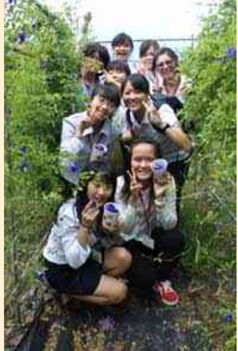
學生手中拿的是「蝶豆花」。