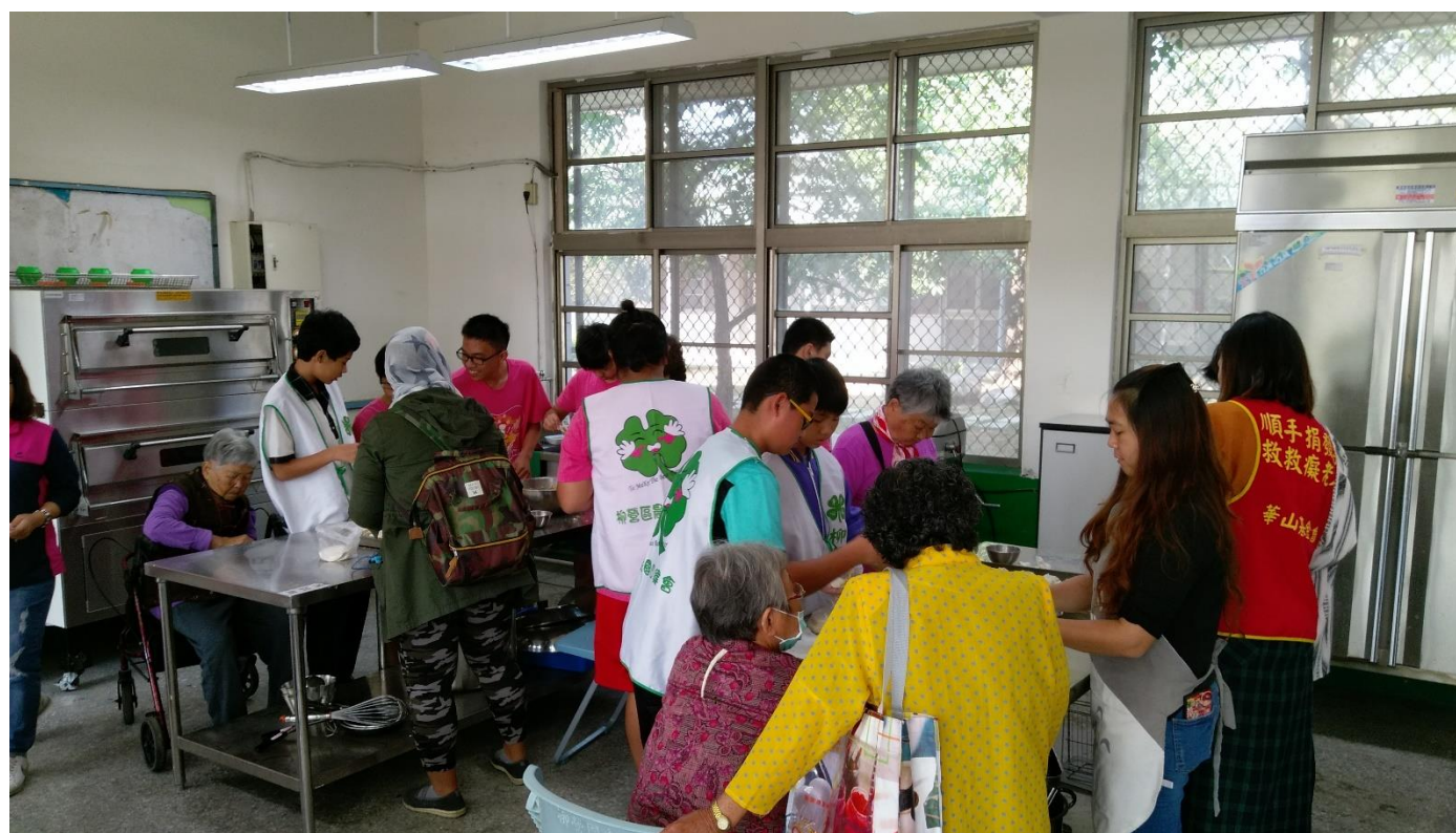
結合社區辦理老人共餐活動 增進祖孫情