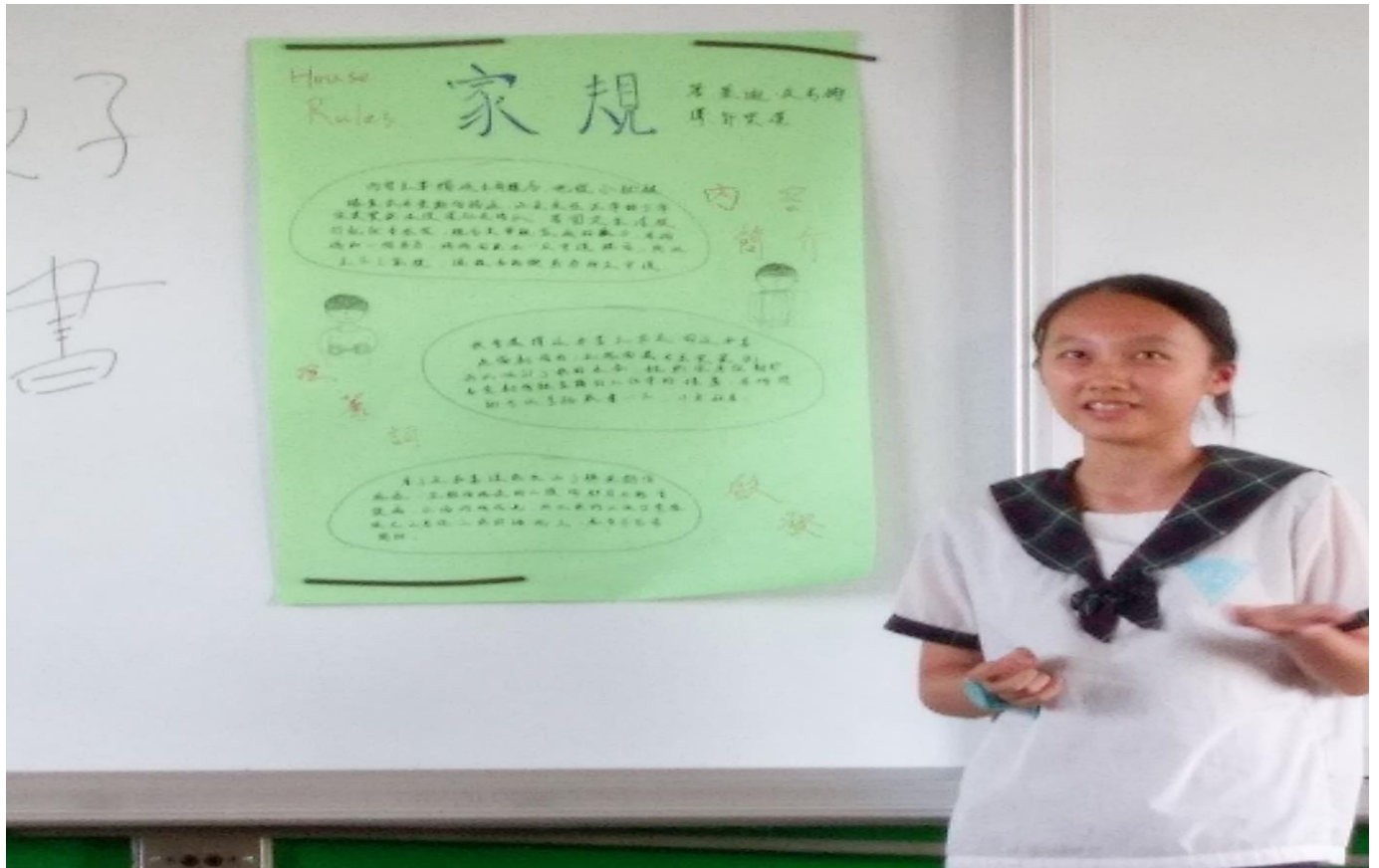
透過閱讀活動讓學生介紹家庭教育好書及分享心得