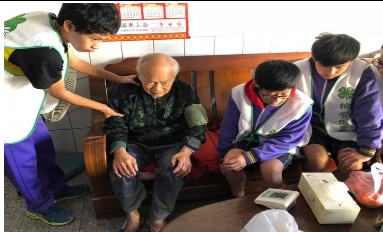
結合華山基金會辦理關懷老人服務活動 促進學生對長者的關心