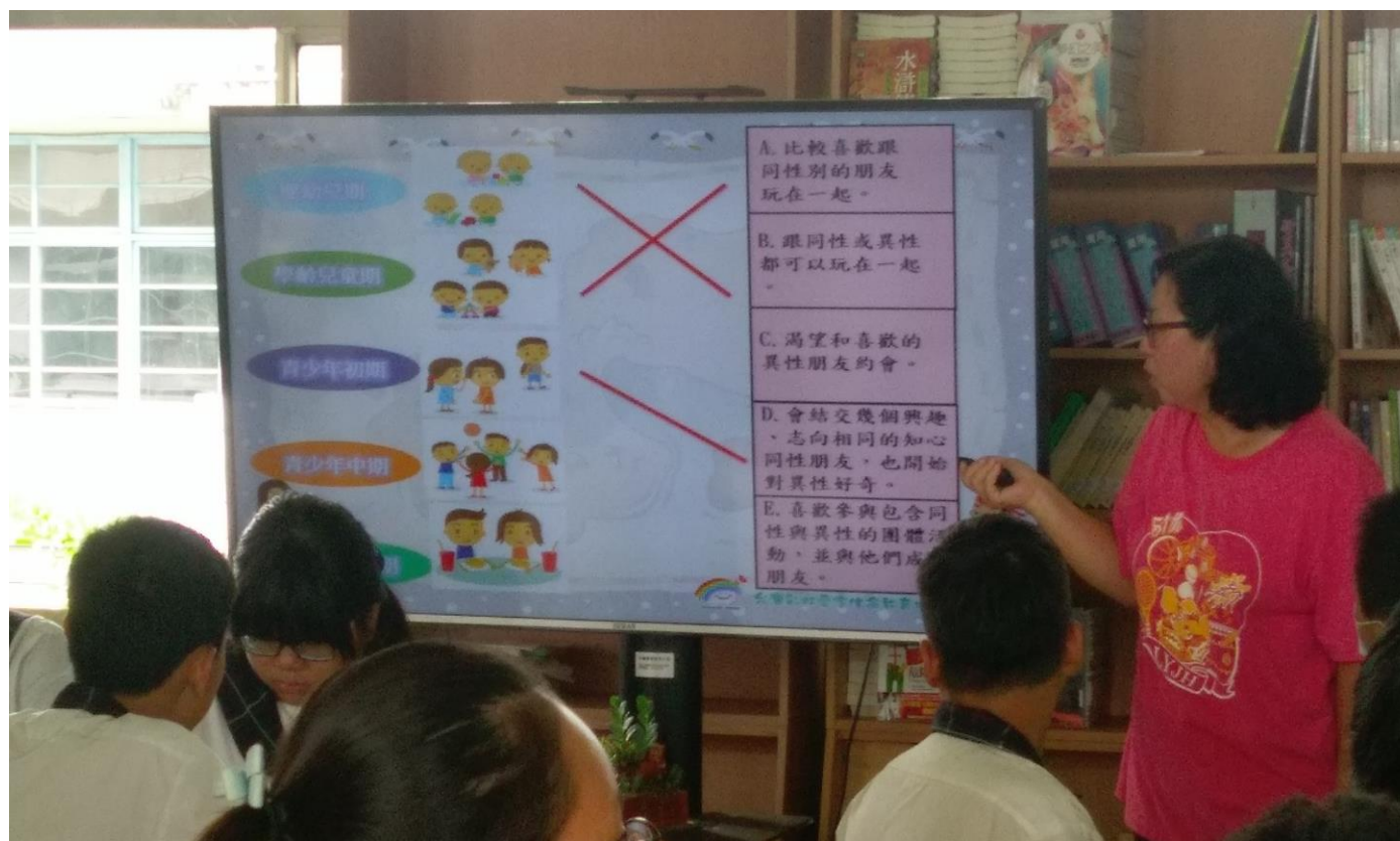
透過彩虹媽媽以說故事的方式引導學生了解家庭中性別平等的觀念