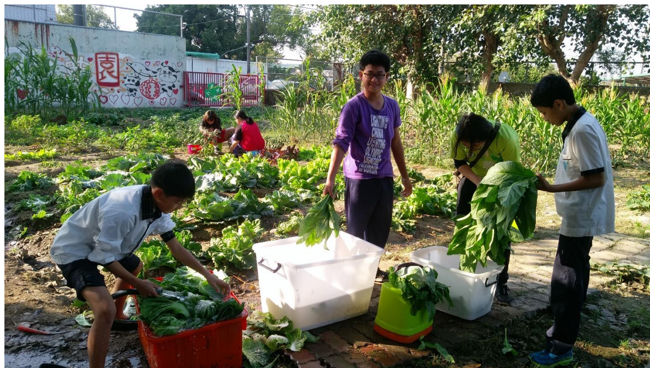
結合食農教育栽種社區老人共餐所需的食材