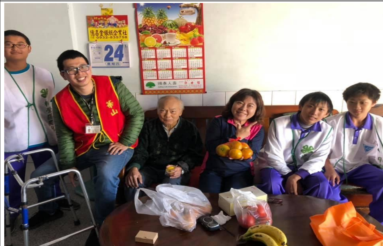
結合華山基金會辦理關懷老人服務活動 促進學生對長者的關心