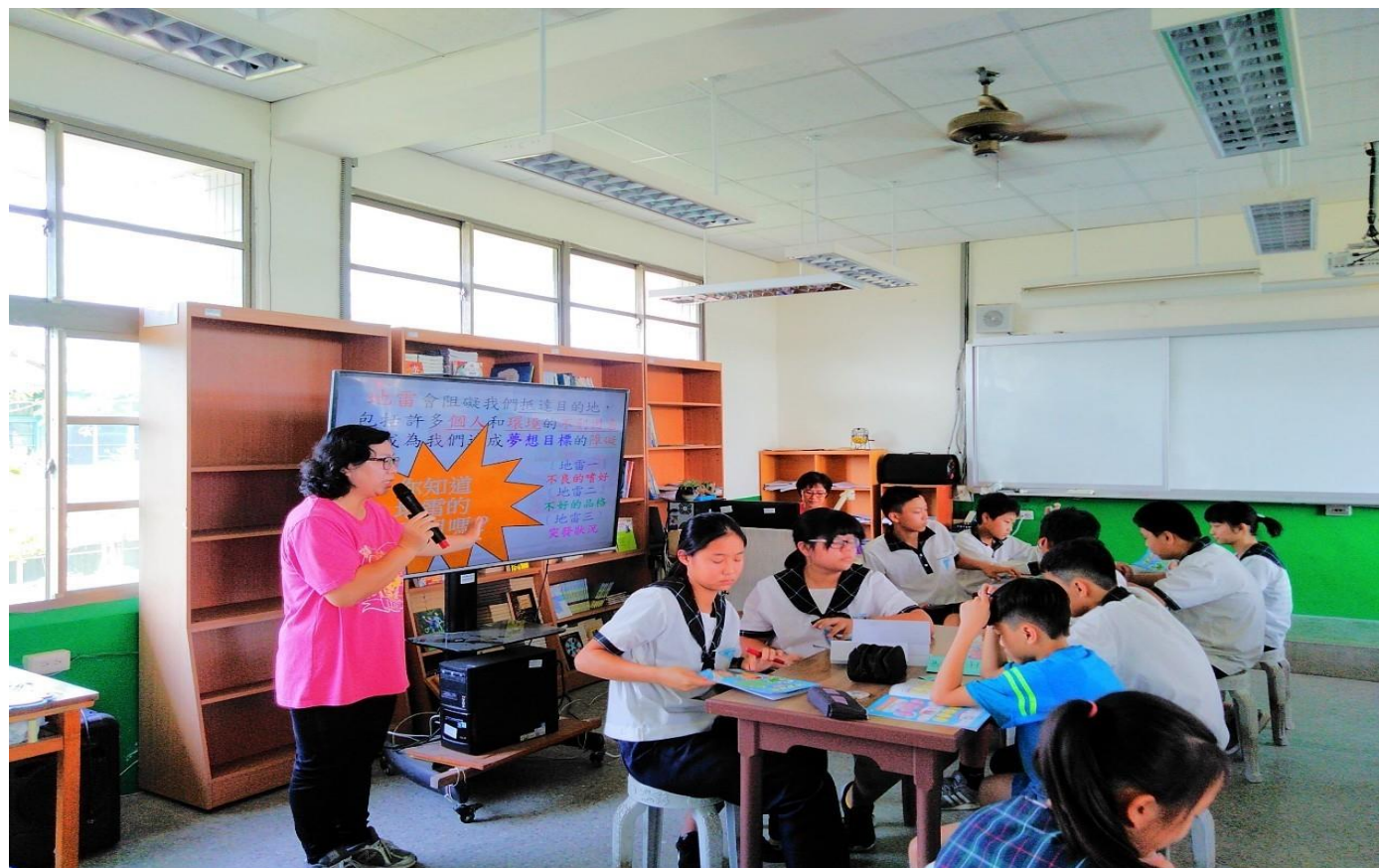
透過彩虹媽媽以說故事的方式引導學生了解家庭中性別平等的觀念